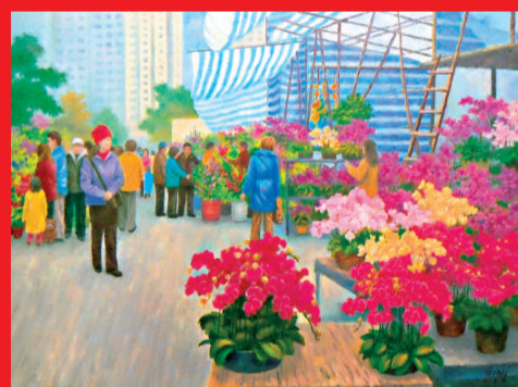
▲《維園年宵花市》繪畫了香港人每年一度的新年活動