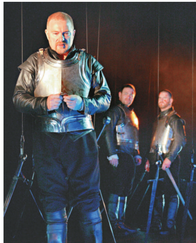
▶《馬克白》展示所謂戰場上的英勇，其實與殘酷的暴力僅一線之差

方針。藝術總監格蘭姆·麥克萊林的獨特舞台設計及導演手法，讓劇團被譽為「自成一格的蘇格蘭舞台」。蘇格蘭拜柏劇團《馬克白》將於十二月十二日至十四日晚上八時；十二月十三日及十四日下午四時，在香港文化中心劇場公演，門票現於各城市電腦售票處發售。