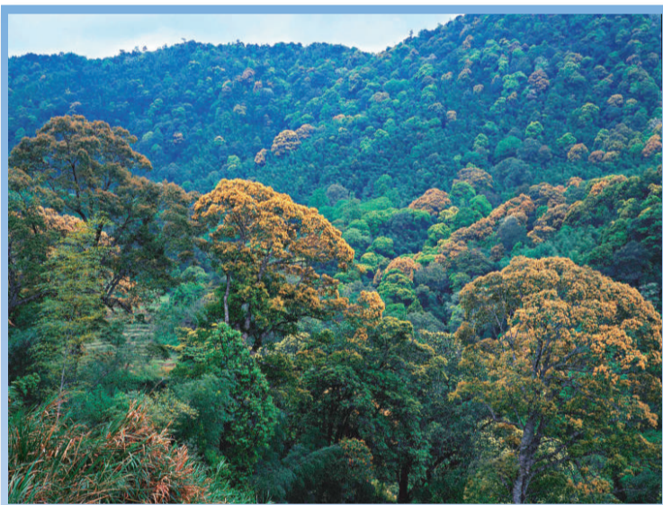
▲茫茫林海 ▼大亞木業是國家重點企業，農業產業化國家重點龍頭企業。圖為該企業在三明投建八億元的亞洲最大刨花板生產線之一

為推動旅遊資源整合，三明相關部門已編製了三明旅遊產業發展規劃，積極打造精品旅遊帶，構建城市休閒服務和遊客集散中心，不斷發展壯大旅遊產業。