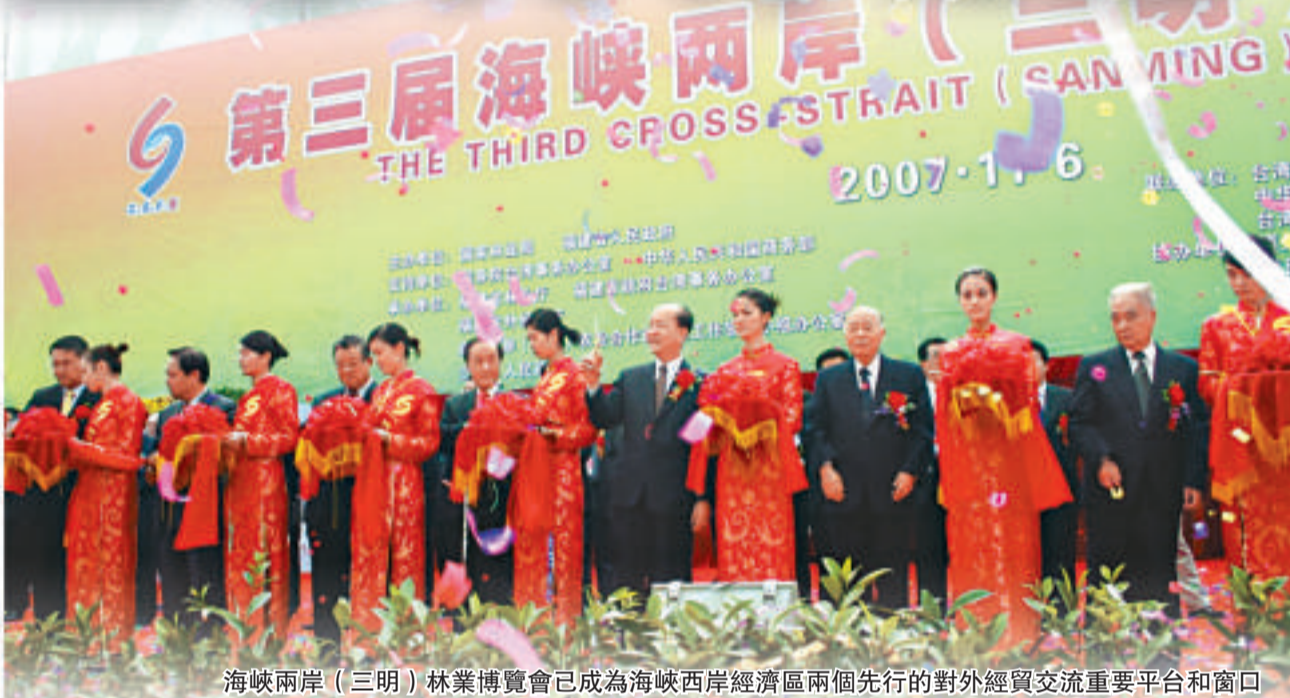
海峽兩岸（三明）林業博覽會已成為海峽西岸經濟區兩個先行的對外經貿交流重要平台和窗口

近年來的全方位發展，三明市在海西建設中前鋒、基地、樞紐、支撐的地位和作用更加凸顯