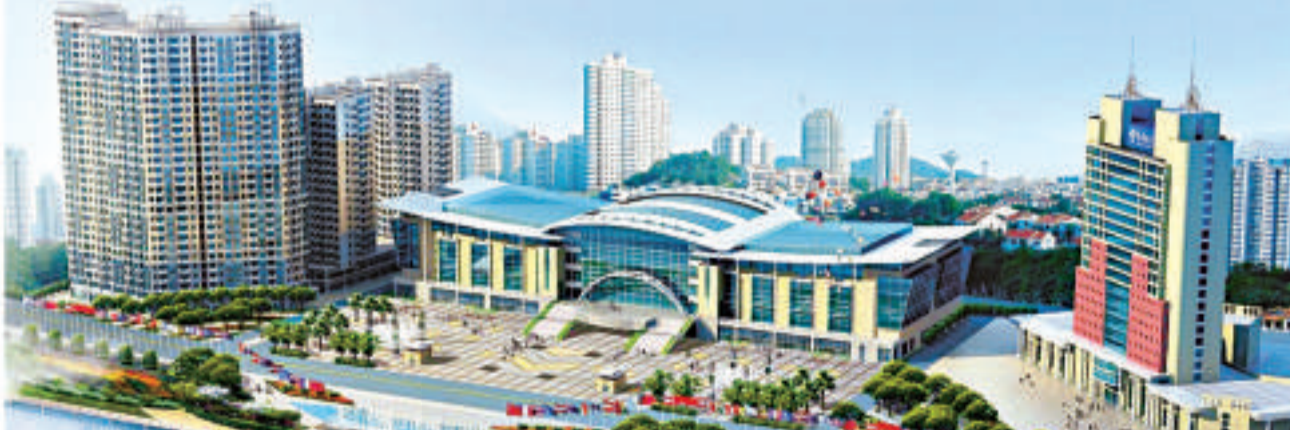
▲即將啓用的三明市科技會展中心 ▼三明將成為國家級交通樞紐，區位優勢愈發突出

據相關部門介紹，三明與台灣的林業有着很強的互補性，明台兩地的合作，尤其在木竹深度加工、產品市場營銷、物種資源交流、生物製藥提煉、生物多樣性保護、森林旅遊開發等領域潛力巨大，前景廣闊。目前，三明已經建成台灣農民創業園和海峽兩岸現代林業合作試驗區，試驗區共劃分成六個功能區，並都進入實際運作階段。