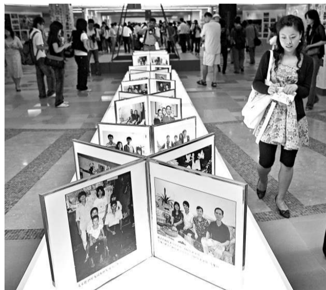
「100名攝影師的深圳記憶」大型圖片展在深開展。展覽以「改革開放30年與一座新城市的視覺回望」為主題，展出100名攝影師的600幅圖片