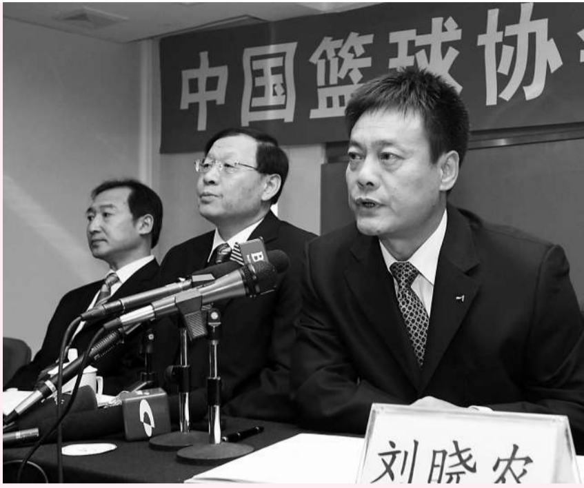
中國籃協高層三日迅速回應事件並表示會用法律手段維權

關於球員的去向問題，鳳鋁方面表示，一隊隊員將掛牌出售，至於二、三隊的球員，會繼續以業餘隊的形式來培養他們。