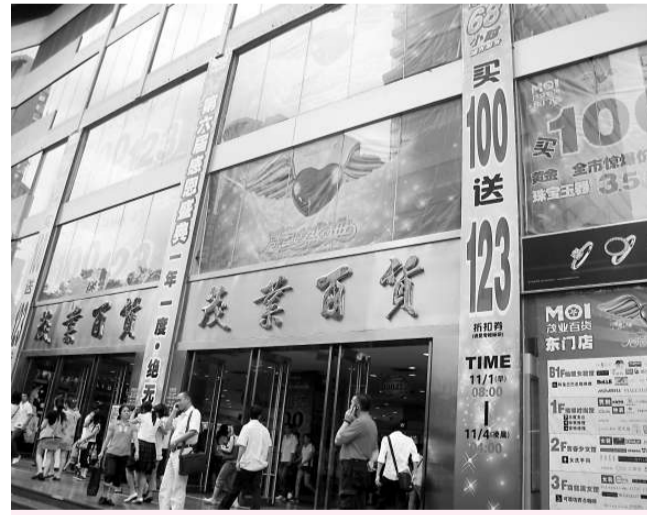
東門商貿削價戰提前拉開戰幔

往年年底才啓動的東門銷售商戰今年提前上演，包括茂業百貨、太陽百貨、天虹商場在內的三大超級商場均在11月初推出各種促銷活動，貨架商品實際優惠幅度遠超去年，吸引女顧客前來掃貨。圖為茂業百貨東門店打出68小時通宵服務、買100元送123元的巨幅廣告。(本報記者毛麗娟)