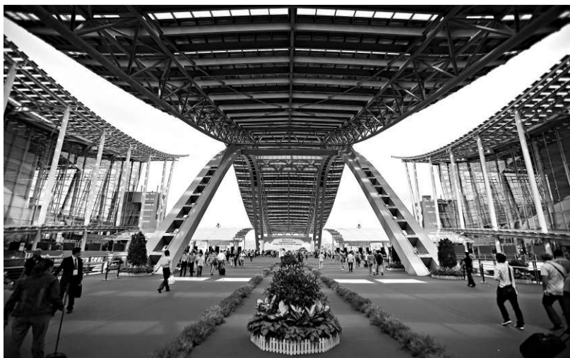
經過7年建設，展館規模居亞洲第一、世界第三的中國進出口商品交易會(廣交會)新展館3日全面啓用。圖為新展館情況

30年前，廣交會的展覽面積僅為13萬平方米，到會客商1.8萬人，成交金額18.8億美元；30年後，第103屆廣交會到會客商19.2萬人，成交金額達382.3億美元。第104屆廣交會全面啓用新展館後，展覽面積進一步擴大到113.1萬平方米。