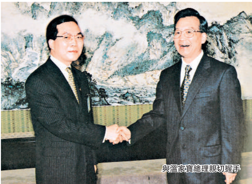
與潘家寶總理親切握手