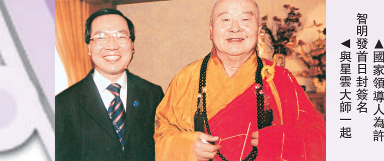
▲國家領導人為許智明發首日特簽名一起 ▲與星雲大師一起