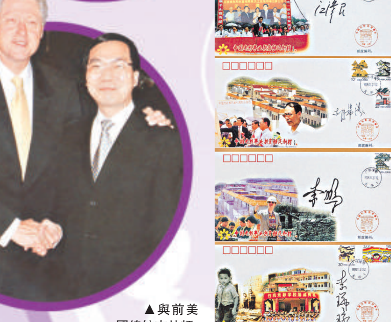
▲與前美國總統克林頓