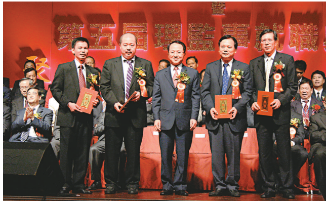
▼中聯辦副主任王志民(中)為新一屆理監事頒發證書