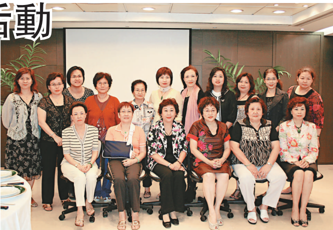
▲出席當日活動的婦女部姊妹們合影

座談會之後，婦女部的姊妹們一起品嚐了美味的客家菜餚，還有卡拉OK助興。大家不但度過了一個美好的夜晚，並通過本次聯誼活動，促進了彼此間的團結和感情。