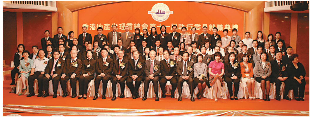
▲香港地產代理商總會第十一屆執委就職禮合影