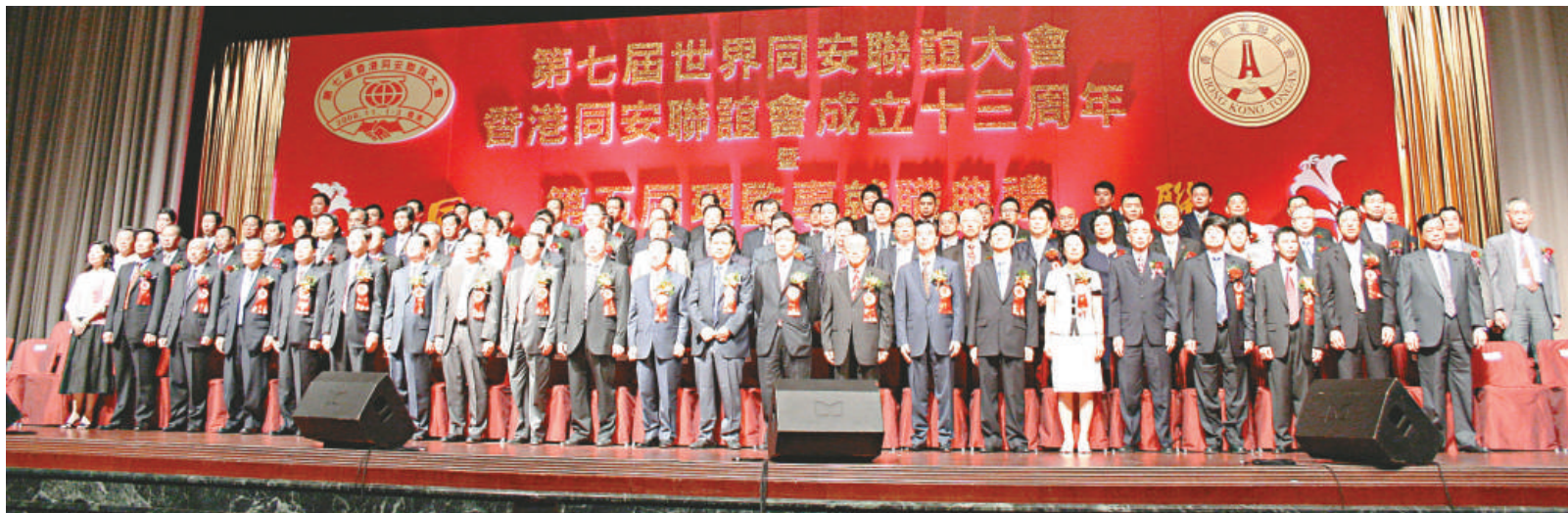
▲主席台上賓主合照