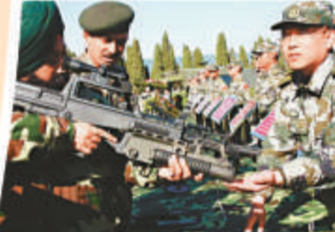
首次中印聯合軍演於2007年12月在昆明圓滿完成，圖為印軍官兵參觀中國軍隊的輕武器