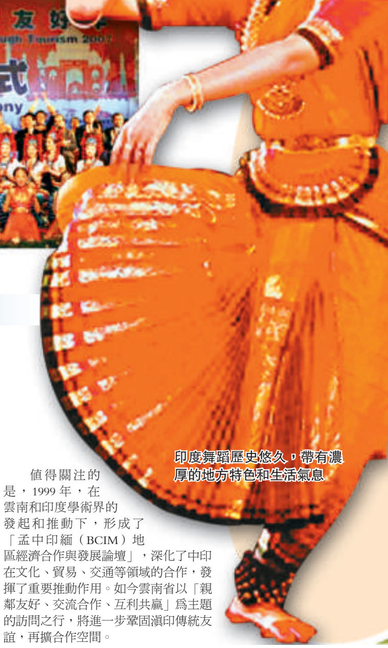
印度舞蹈歷史悠久，帶有濃厚的地方特色和生活氣息

多年來，雲南積極開展與印度的多方面合作。雲南省先後有3位省領導率雲南代表團訪印；有多個學術代表團數次赴印參加國際會議和考察；經貿界連續多年組織參展團赴印；雲南新聞界也多次派出代表團出訪印度。印度也相繼有駐華大使等外交官、研究機構、高校團體學者訪問雲南。印度總統納拉亞南曾在中印建交50周年之際專程訪問雲南，前雲南省副省長、現國家旅遊局局長邵琪偉曾率百人代表團乘坐包機從昆明直飛新德里，寫就了中印簽訂航空協定以來的首次商務飛行歷史，從而載入滇印友好交往史冊。