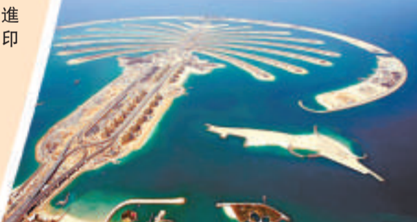
迪拜棕櫚島被稱為世界第八奇跡的人工島，是古巴比倫空中花園式的驚人想像力和古阿拉伯富豪豪華氣派的結合體

中國國家旅遊局局長邵琪偉在「中印旅遊友好年閉幕式」上指出，中印兩國友好交流機制日臻成熟，領域不斷擴大，美好未來令人憧憬。據統計，今年1至9月，雲南與南亞國家共實現貿易額6.96億美元，較去年同期增長153.7%，其中印度連續多年成為雲南在南亞國家最大的貿易夥伴，與去年同期增長151.9%，經貿往來日益繁榮，雙邊貿易持續增長。11月7日，中國雲南省與印度西孟加拉邦經濟合作(K2K)國際研討會第四次會議又將於雲南大理舉行，再掀合作新高潮。此次印度政府敞開大門，向雲南伸出合作橄欖枝，主動推進雲南與印度的交流，它又將成為滇印合作新里程碑。