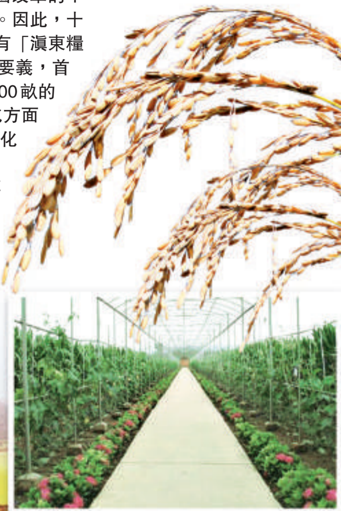
曲靖是雲南重點的農業大市，其農產品加工企業年加工能力達到160萬噸，居雲南首位