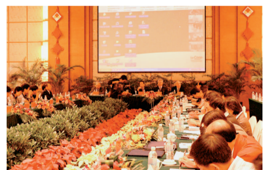
加拿大專家和北京市、雲南省、曲靖市官員及企業家齊聚曲靖共商農業發展對策

曲靖是著名的「珠江源頭第一市」，經濟總量已連續4年穩居雲南省第二位。曲靖一直以來而有力的改革實踐和創新能力走在雲南前列，不僅掀起了對中國水電事業具有劃時代影響力的「魯布革衝擊波」，並創造了中國醫療改革具有重大意義的「宣威模式」，中小學示範教育在雲南省名列前茅，適逢十七屆三中全會的召開，業已受多方關注的曲靖與時俱進，緊跟形勢，抓住機遇，大膽改革農業發展新思路，與加拿大天辰國際集團聯袂打造建設具有劃時代意義的項目「現代農業產業示範園」。