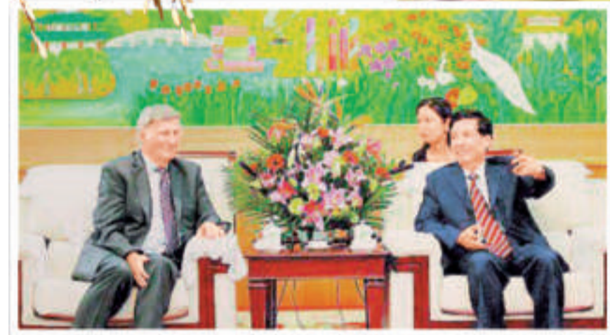
雲南省省長秦光榮（右）8月會見加拿大天辰國際集團董事長布克

今年5月，在「現代農業產業示範園」即將開建之際，來自加拿大的多位專家、北京市、雲南省、曲靖市的官員和企業家齊聚曲靖珠江源，分別就「世界農業趨勢及對中國農業的看法」和「加拿大農業合作的模式及對中國農業合作前景的看法」兩大問題展開廣泛探討，共商中國農業發展對策，為園區的建設作了良好鋪墊。本報記者有幸獨家獲邀採訪。