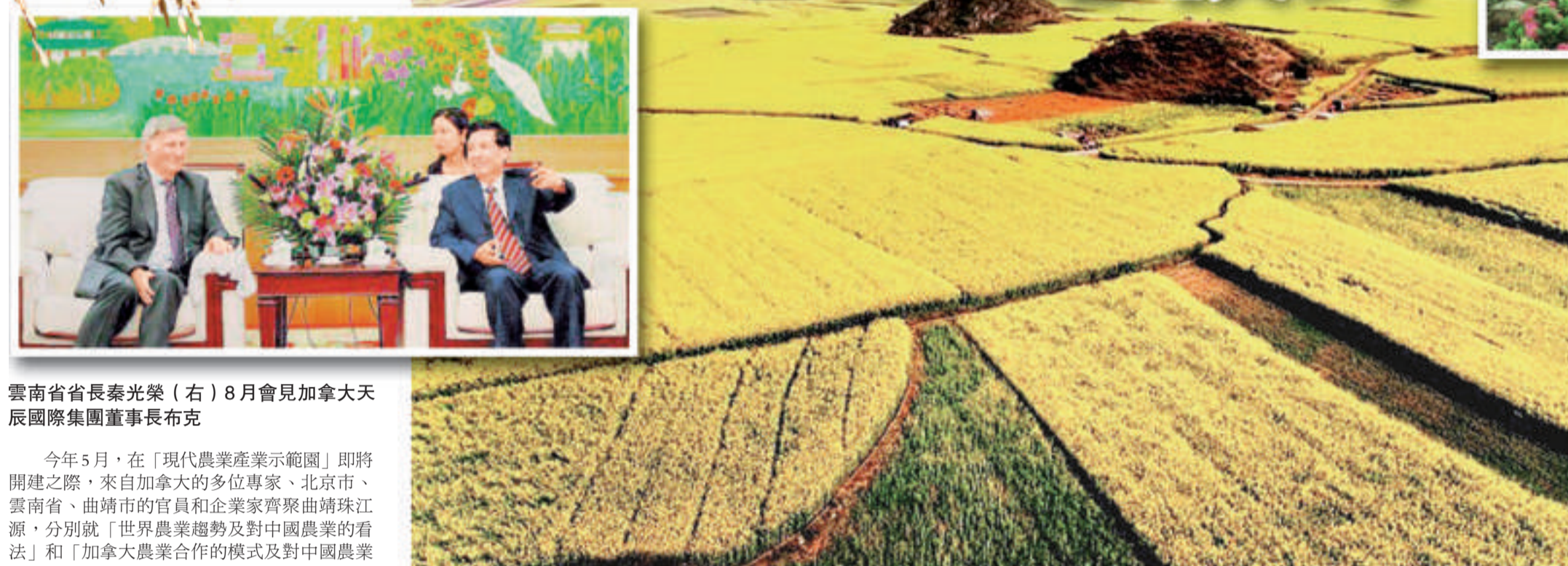
曲靖羅平油菜花被譽為世界級超級油菜花海，年產油菜籽近3000萬公斤，是雲南省最大的油菜籽生產基地