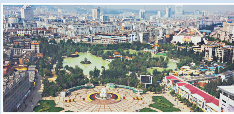
珠江源廣場為曲靖麒麟城中心，始建於1983年，園內山色倒映，波光瀲灩，亭台樓榭布局得當

齊文表示，人才問題是制約農業產業化的重要問題，因此農民的培訓和再教育顯得十分重要，園區將會定期組織官員及農民赴加進行教育培訓，提高生產者素質，樹立生產責任感。這都將對促進中國農業現有發展模式和結構的現代化進程起到重要作用。目前該園區已進入設計階段，待方案最終確定後將公開開建。