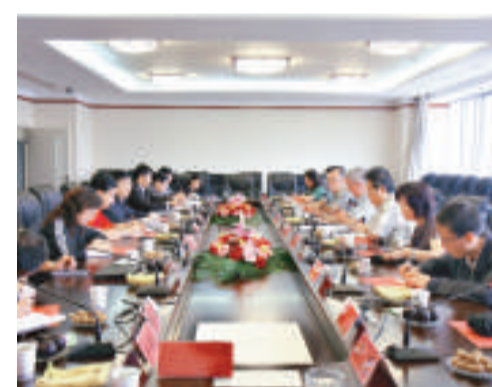
雲南農業大學李正副校長會見到訪的曲靖市副市長周玲和加拿大天辰國際集團一行