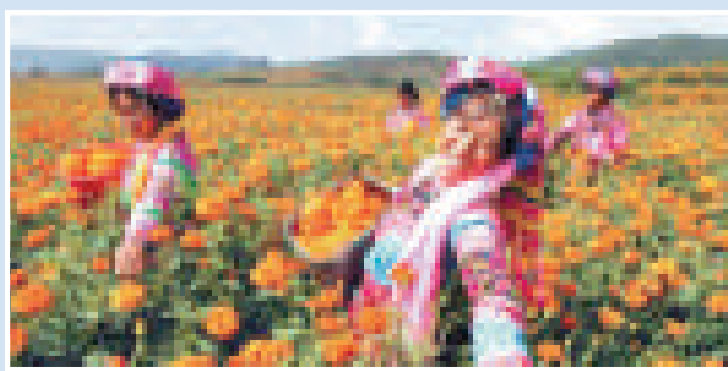
曲靖市萬壽菊自1998年引種試種成功後，今年全市種植面積達15.7萬畝，產量居全國前列