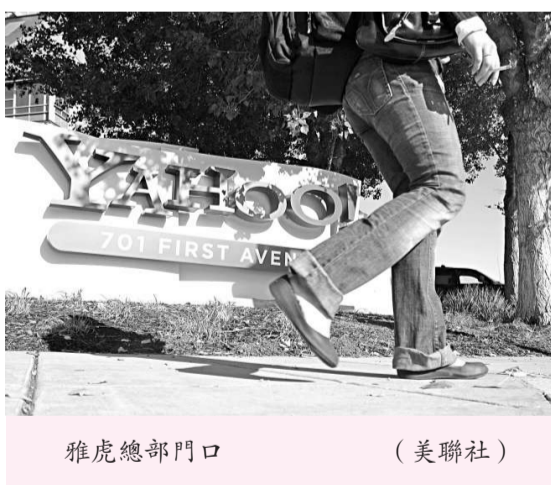
雅虎總部門口

谷歌和雅虎今年六月簽署了一份非排他性搜索廣告合作協議。根據協議，雅虎可在其主網站及美國和加拿大合作網站的搜索欄中投放谷歌廣告，並有權決定谷歌廣告的投放位置和方式。這一交易將使雅虎每年增加八億美元的收入。