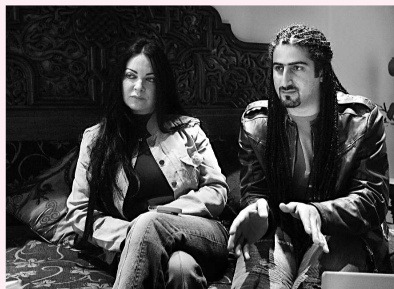
【本報訊】據新華社馬德里五日電：西班牙內政部五日拒絕批准「基地」組織領導人烏薩馬·本·拉登之子奧馬爾·烏薩馬·本·拉登（上圖右）的政治庇護申請。奧馬爾可在二十四小時內申請復議。

奧馬爾三日從埃及開羅搭乘航班前往摩納哥的卡薩布蘭卡。但在經停馬德里機場時，他突然走下飛機，向西班牙政府提出政治庇護的請求。西班牙內政部表示否決奧馬爾的政治庇護申請，原因是他不符合入境西班牙所需條件。