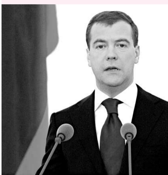
▼梅德韋傑夫透過電視向全國發表他上任以來第一篇國情咨文（新華社）

不丹第五世國王旺楚克六日在不丹首都廷布舉行加冕典禮。旺楚克國王現年二十八歲，是當今世界上最年輕的國王。（法新社）