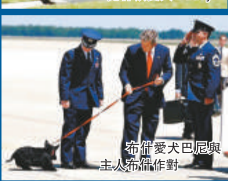
布希愛犬巴尼與主人布希作對