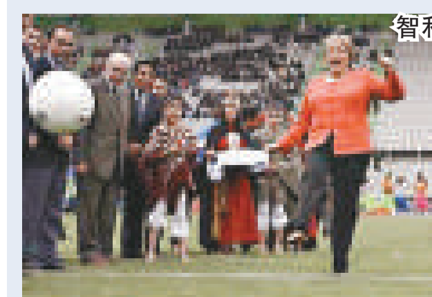
智利女總統把鞋踢飛3米外

今次測序的基因組來自一名患上急性骨髓性白血病（AML）的五十歲婦女。研究人員抽取健康的皮膚細胞DNA，將之與她的癌細胞DNA比較，結果在腫瘤DNA中發現了十個可能與AML有關的遺傳變異，當中八個之前從未認為與AML有關。