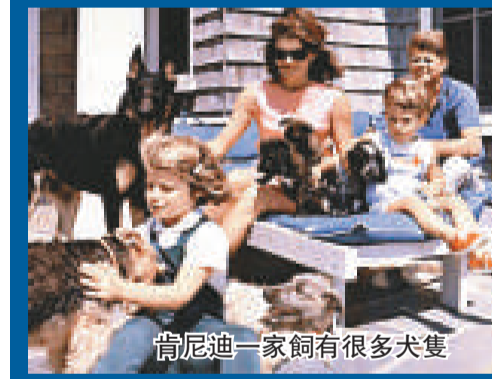
肯尼迪一家飼有很多犬隻