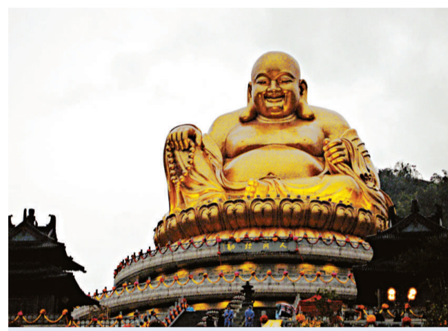
奉化雪竇山露天彌勒大佛銅像

【本報記者王學東杭州八日電】2008中國（奉化）雪竇山彌勒文化節七日在浙江奉化溪口雪竇山國家風景名勝區隆重開幕，新近落成的雪竇山露天彌勒大佛銅像於今日盛大開光。奉化是五代後梁高僧布袋和尚的故鄉。布袋和尚被稱為是彌勒化身，其笑口常開的形象，長期以來深受民眾的信奉和喜愛。最近落成的雪竇山露天彌勒大佛，就是根據布袋和尚的模樣塑造的。該大佛為全世界最高的坐姿銅鑄露天彌勒大佛造像，總高度為56.74米，其中銅製佛身33米，蓮花座9米，基座14.74米。