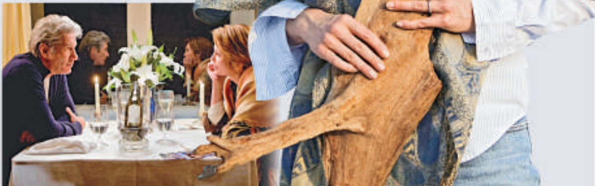
▲ 李察基爾（左）與戴安蓮相逢恨晚