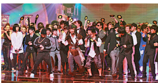
▲ 無線生日將至，日前率先以《翡翠歌星賀台慶》祝壽