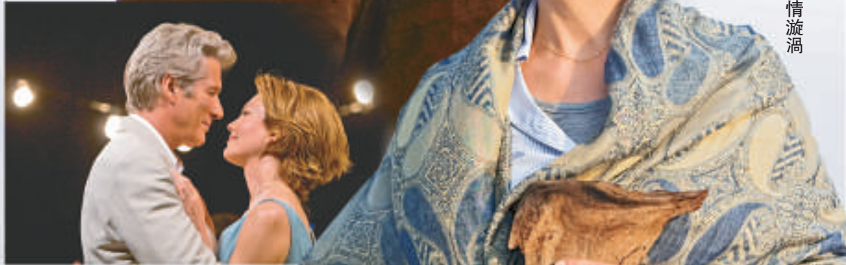
▲ 電影以成年人的感情為題旨