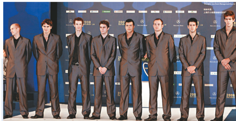
▲八位網壇大師英氣勃發，參加大師杯賽開幕禮

頂尖男單選手和8對男子雙打選手西裝革履出現在上海展覽中心，攜手參加開幕儀式，個個顯得英俊帥氣。談到明天開幕的未上上海大師賽，每位都有自己的憧憬。