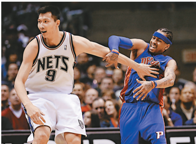
▲籃球小將易建聯(左)敢與活塞大球星艾佛遜爭高下

為了規範廣州亞運特許市場，廣州亞運會推出特許經營總體計劃，嚴格控制特許企業的數量，強化商品設計審批和質量管理。根據該計劃，亞運特許總共徵選約60家特許企業(生產商和銷售商各30家左右)，開設4000餘款商品，開設500至800家特許專賣店進行銷售。【本報記者呂劍廣州八日電】