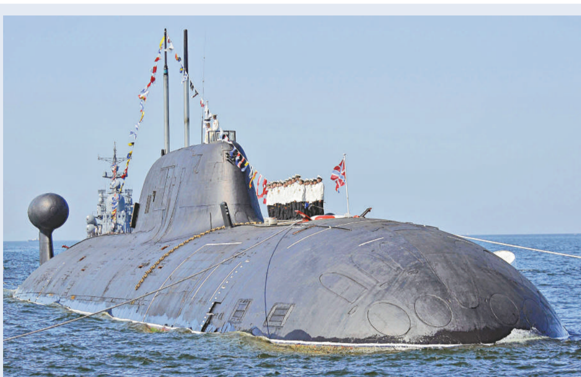
▲與出事潛艇同類的「阿庫拉」級核潛艇（資料圖片）

這次意外是俄羅斯八年來最大宗潛艇意外事件。二〇〇〇年，「庫爾斯克」號核潛艇在巴倫支海爆炸沉沒，一百一十八名船員喪生。克里姆林宮當年因應變遲緩和左右搖擺而備受嚴厲抨擊，但今次卻回應迅速，以免