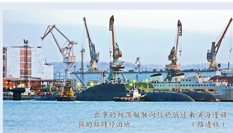
出事的核潛艇駛向位於俄遠東濱海邊疆區的臨時停泊地

重蹈覆轍。俄羅斯媒體報道說，國防部長謝爾久科夫在事故發生後立即向總統梅德韋傑夫匯報了情況。梅德韋傑夫責成謝爾久科夫全面調查事故原因並撫恤遇難者家屬。謝爾久科夫隨即命令國防部第一副部長科爾馬科夫和海軍總司令維索茨基上將立即派往位於俄濱海地區的潛艇臨時停泊地。 而據英國媒體報道，過去五十年來，至少有五百名俄羅斯核潛艇的船員死於非命。分析家指出，俄羅斯本來有意在國際舞台上展示軍力，今次的意外使莫斯科大失臉面，克里姆林宮將難以繼續向外國擺出強硬的軍事立場，其野心日大的國防工業也受到了打擊。