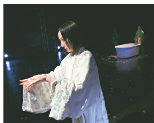
梁紅玉征戰疆場有功，卻拒受厚封，隱居妓院，終日混沌

北京人民藝術劇院導演、劇作家李六乙是中國劇場先鋒人物之一。他執導的《莊周試妻》、《軍用列車》、《原野》、及編導的《雨過天晴》、《非常麻將》等話劇均獲好評。他還大膽借鑒戲曲元素，透過《四川好人》（川劇）、《貧嘴張大民的幸福生活》（評劇）、《宰相劉羅鍋》（京劇）、《白蛇傳》（豫劇）、《偶人記》（崑劇）等作品，進行了多方面的新嘗試，