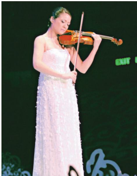
姚珏將於本周三晚上在香港大學陸佑堂舉行音樂會