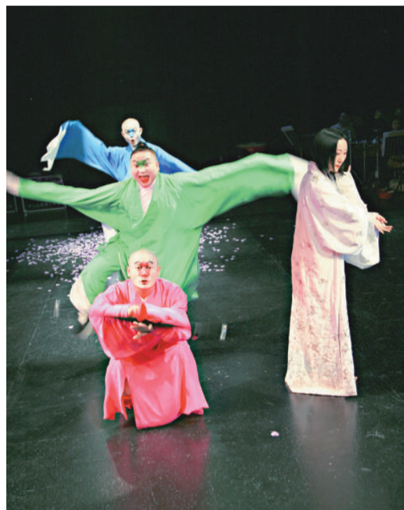
三位仰慕紅玉的亡魂乘夜來訪，為解紅顏惆悵，插科打諢

【本報訊】中國當代劇場先鋒李六乙，將梁紅玉這位宋代巾幗英雄的事跡大膽改編，以嶄新手法搬上舞台，並由著名作曲家郭文景為經典劇目譜上新曲，透過多種聲腔戲說人鬼情。現代劇場手法穿越古今，加上演員的動人演繹，一個前所未見的梁紅玉，將令觀眾耳目一新。