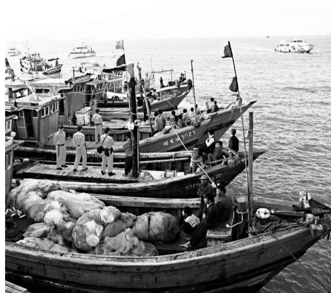
海巡署金門海巡隊十日執行海域掃蕩，查獲八艘「撈過界」的福建籍漁船，押回水頭港處分。

【本報訊】據中央社金門十日消息：台灣海巡署海洋巡防總局今天實施海域大掃蕩，金門海巡隊會同金門縣政府護漁小組出擊，查獲八艘越界作業大陸漁船、逮捕三十六名大陸漁民，查扣漁網一百五十件。