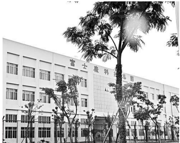
富士康淮安科技城已經建成的廠房外景（本報攝）