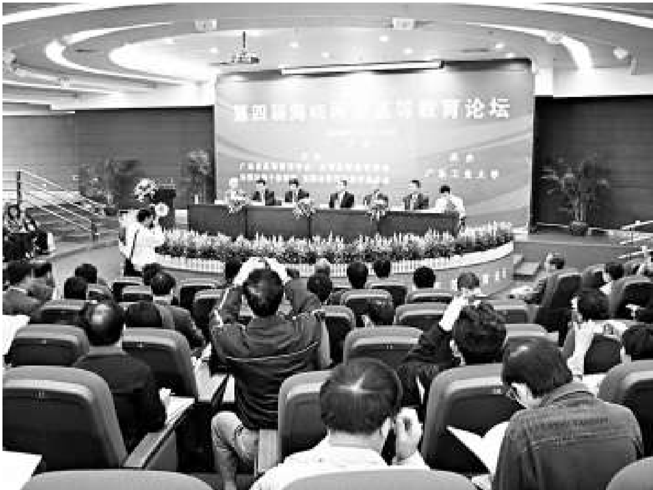
兩岸六十多所高校的領導和高教研究員雲集廣州，參加海峽兩岸高等教育論壇

廣東省委教育工委副書記譚澤中表示，舉辦此次論壇是爲了進一步深化高等教育大衆化、普及化階段人才培養政策，也爲海峽兩岸高等教育交流及其機制的建立，增進雙方高等學校之間的了解和交流合作創造更多的機會，同時也將推動兩岸高等教育的改革和發展。