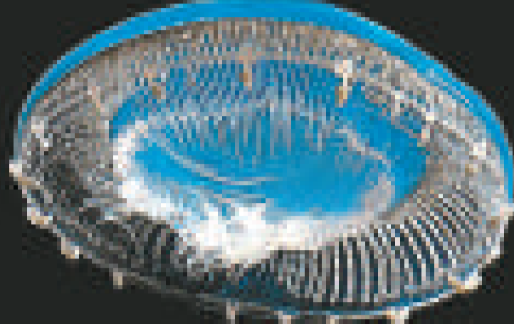
▲研究隊伍發現的大量新品種水母包括大太平洋的「大型多管水母」