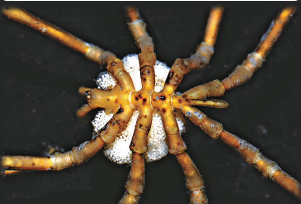
▲雄性的海蜘蛛把蛋藏在腳下