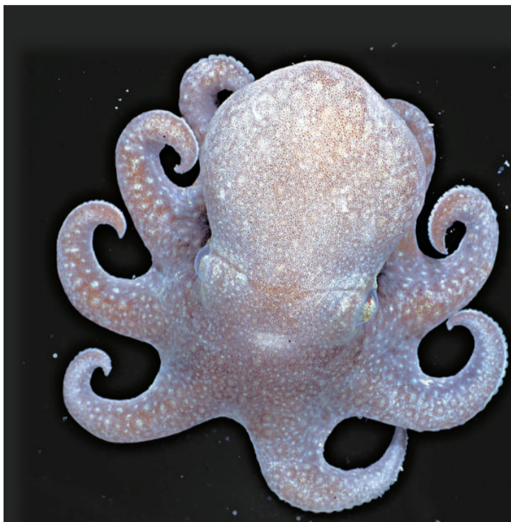
▲在南極發現的八爪魚祖先