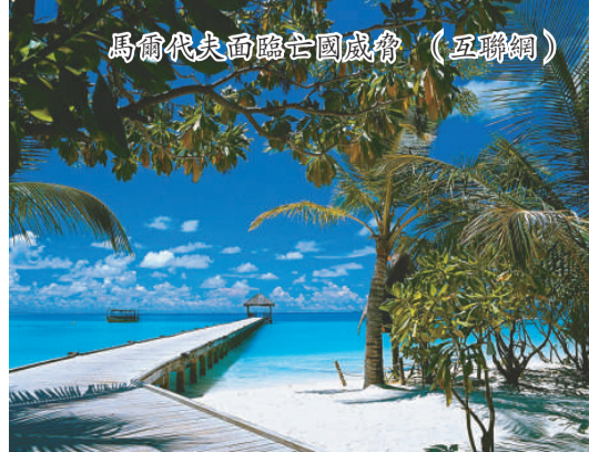
馬爾代夫面臨亡國威脅 (互聯網)

納希德又說，他已開始與多個國家討論買地事宜。目前，印度和斯里蘭卡都初步表示願意收容馬爾代夫人，因為這兩國的文化和氣候都和馬爾代夫的相似。另外，幅員遼闊的澳洲也在考慮之列，因為當地尚有大量土地未被開發。