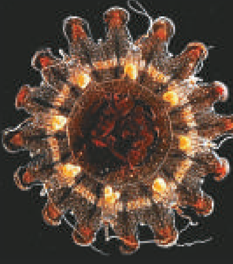
▼一種在加拿大對出的北冰洋海域發現的櫛水母