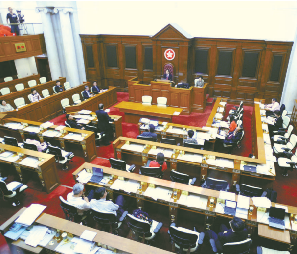
香港部分立法會議員的議事和質詢態度，反映了其人際溝通技巧差

表達語言信息，將會易於與人建立良好的 interpersonal 關係。首先，我們與人溝通時，除了陳述己見之外，也應設身處地站在對方的立場為他着想。因此，我們可以適當地使用「我知道你……」、「好像你會感到……」之類的話，以拉近