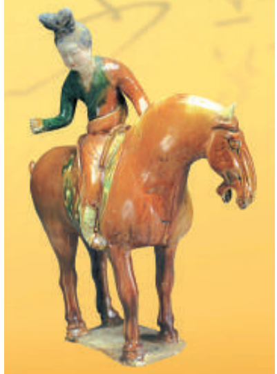
唐三彩馬球仕女俑

窰、戰國的龍窰、南宋的階級窰，以至現時的隧道窰，逐步掌握了較科學的燒窰技術，調節空氣和火焰的流速，提高燒成溫度等。