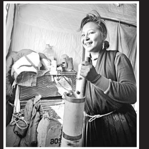
西藏自治區常務副主席白瑪赤林介紹稱，西藏目前的局勢平穩。圖為一藏族牧民在帳篷內打酥油茶（新華社）