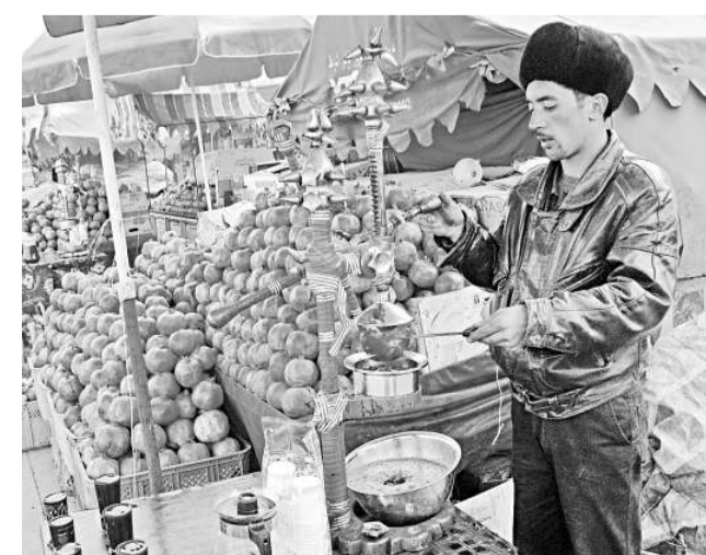
喀什市的商戶正在榨石榴汁，但客人稀少