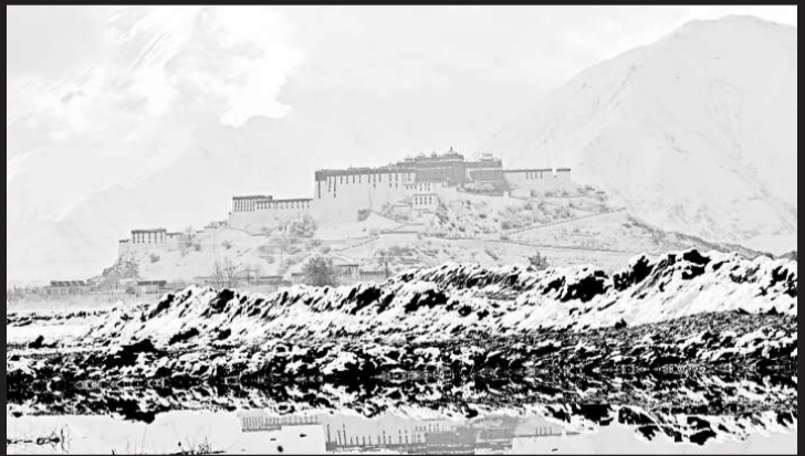
受北部冷空氣影響，拉薩近日下起了大雪