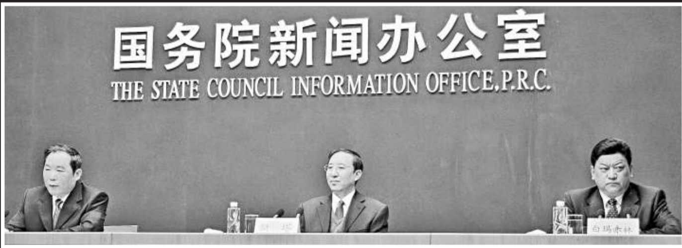
左起：中央統戰部常務副部長朱維群，中央統戰部副部長斯塔，西藏自治區常務副主席白瑪赤林