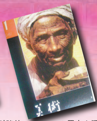
▲羅中立顛覆了勞動者在美術作品中的慣有形象