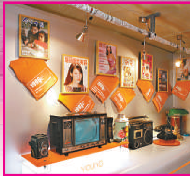
▲老式巴士內展廳實景