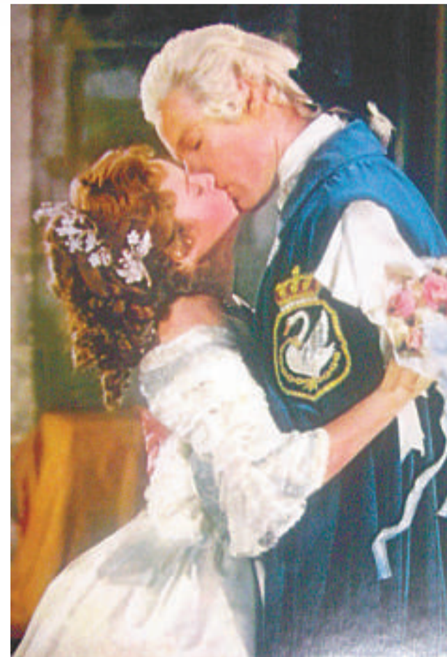
▲英國電影《灰姑娘》的吻照當年引起軒然大波