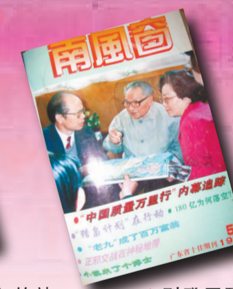
▲刊登了鄧小平南巡照片的雜誌