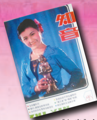
▲《知音》創刊號的導讀標題，令讀者首次直面「第三者」等婚姻問題