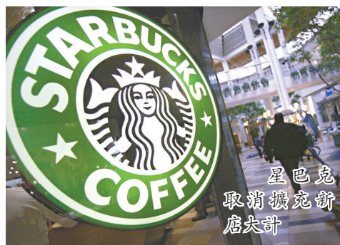
星巴克取消擴充節店大計

星巴克第四季純利跌至540萬美元，或每股1美仙，大幅低於一年前1.585億美元，或每股21美仙。撤除關閉蝕錢分店及裁員開支，每股賺10美仙，表現較分析員估計的每股獲利少