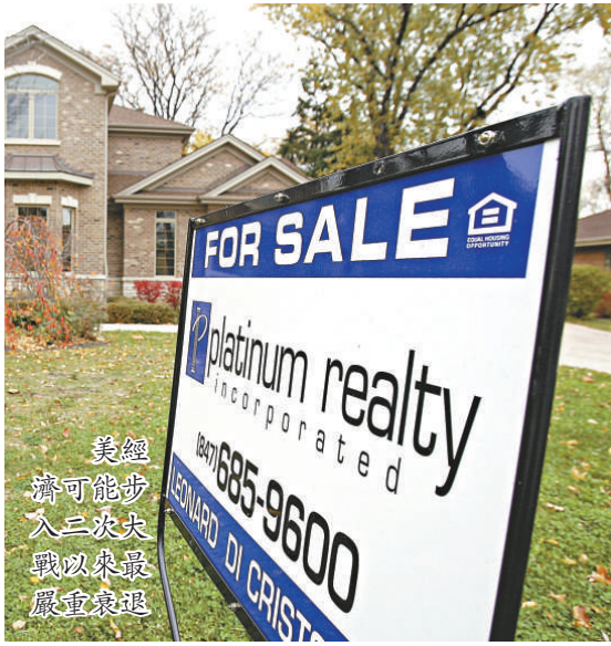
美經濟可能步入二次大戰以來最嚴重衰退

美國經濟研究局(NBER)對前景甚感悲觀，並預言美國經濟有可能步入二次大戰以來，最嚴重衰退。