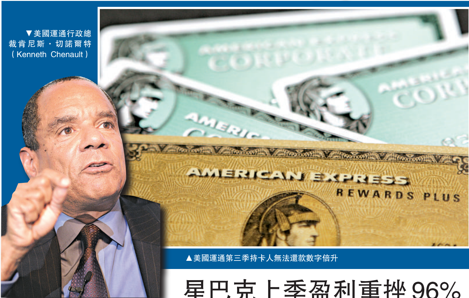
▲美國運通第三季持卡人無法還款數字倍升

此外，美國「兩房」，即房利美和房地美，以及其他房貸機構官員也在研究房屋抵押貸款重組方案，把每月的還款額降低到月收入的38%，「兩房」認為這是數以萬計面對房屋被沒收的貸款人能夠承受的水平。