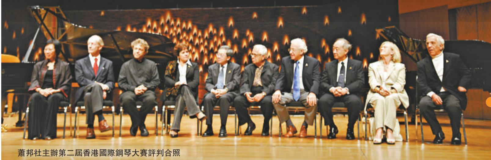
蕭邦社主辦第二屆香港國際鋼琴大賽評判合照

由蕭邦社主辦的第二屆香港國際鋼琴大賽，已於十月十八日圓滿舉行，冠、亞、季軍及其他優異獎得主已經順利選出，而他們的得獎後演奏亦於十九日舉行。本文並非報道大賽詳情，而是縱論大賽後（即二十及二十一）由大賽評判擔演的兩場專家音樂會。