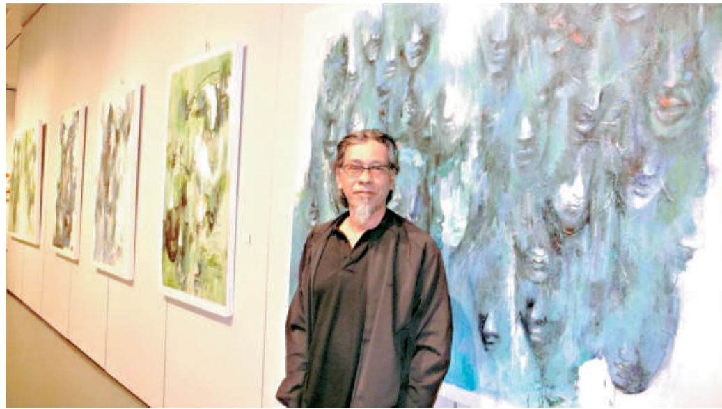
Yusof 的作品展現不同表情的臉孔

印度等地，便運用所見所聞的經驗，作為創作的元素，但他想表達的中心思想都是離不開人性的展現。