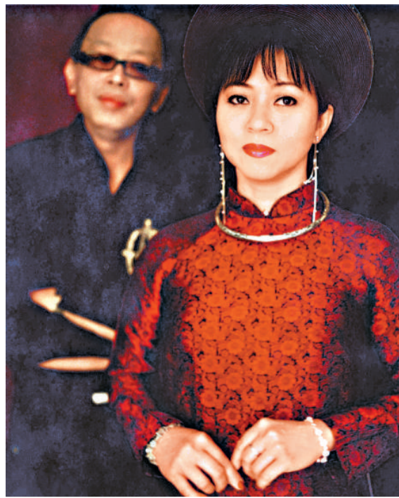
、自由奔放的爵士樂巧妙結合，帶來一場風格獨特的越南歌曲

【本報訊】越南裔的聲譽擅長演繹越南小調民歌，而出色的結他手阮黎則勇於創新結合音樂類型，他們將溫柔婉約的越南歌曲，和自由奔放的爵士樂巧妙結合，加上日本箏、非洲敲擊樂、鋼琴，以及越南傳統樂器的即興對話，「鏡花」是一場風格獨特的音樂會。