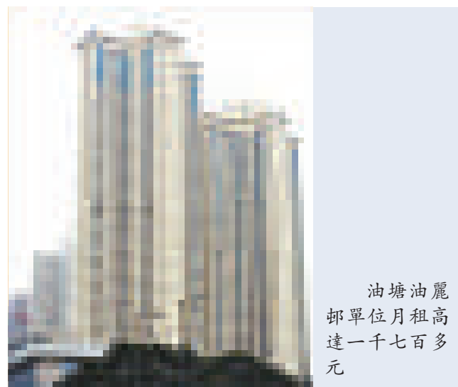
油塘油麗邨單位月租高達一千七百多元

另外，國際金融中心商場將呈獻全港獨有的室內巨型摩天輪，該摩天輪樓高近四層，重約六公噸，摩天輪上裝上逾二萬個燈泡，本月十九日便會隨之亮起。而又一城亦將會出現全港室內最高環保聖誕樹，為整個聖誕添上更濃的節日氣氛。