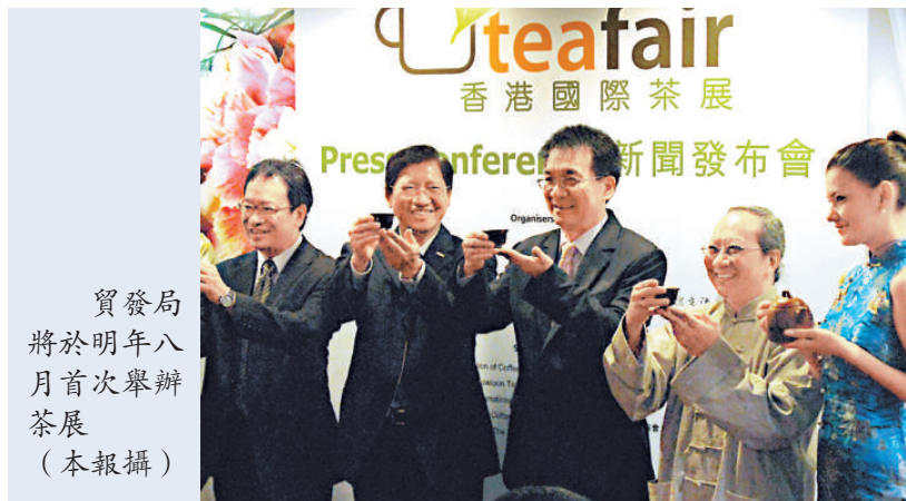
貿發局將於明年八月首次舉辦茶展

【本報訊】記者于靜報道：經濟危機下，茶能平衡情緒，又能減壓。明年八月香港將首辦國際茶展，貿發局表示，由於環球茶葉及茶製品需求不斷增加，茶貿易將為港企帶來巨大商機。