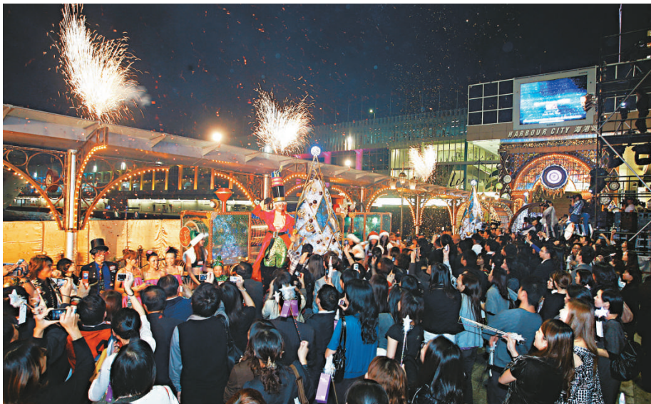
海港城昨晚舉行聖誕亮燈儀式，吸引大批市民參加