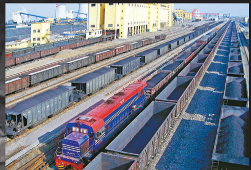
▲安徽淮北鐵運處停滿煤炭專運列車 (資料圖片)

據了解，山西省中小企業局將出台一系列措施，幫助中小企業渡過難關。措施將包括暫緩14個月回收2.4億元，該資金是近年來省裡扶持中小企業發展的鄉鎮企業發展基金，並在本月展開中小企業政策落實情況督查活動。下一步將引導煤焦企業改變投資路線，向旅遊、農業、餐飲、服務等行業靠攏。