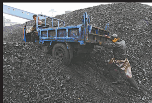
▲工人正竭力把小貨車推上煤堆 (資料圖片)