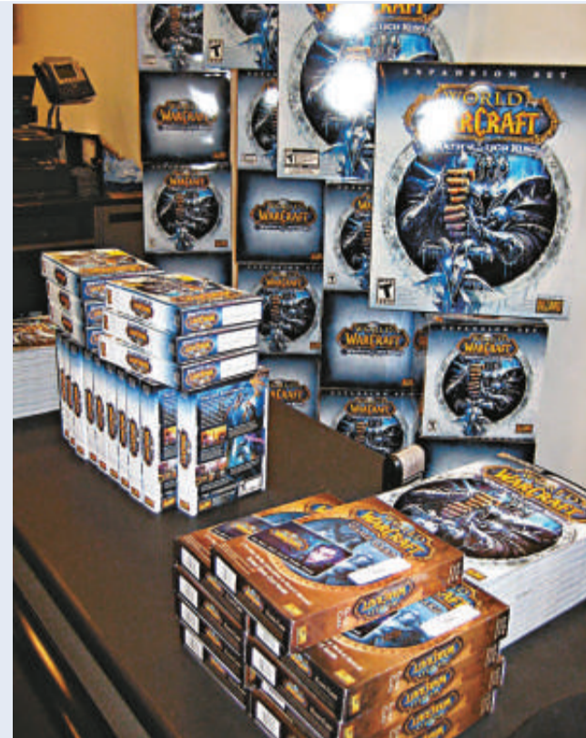
▲近千萬玩家期待已久的《魔獸世界：巫妖王之怒》

拉格洛夫說：「我們不知道《魔獸世界》玩家的上限會去到哪裡，我們拭目以待，但唯可肯定的是，電腦遊戲已經成為娛樂世界的新崛起的力量。」此前，有不少分析人士認為電玩業已成為大眾娛樂行業的龍頭。事實上，在金融海嘯的衝擊下，電玩界是唯一仍然錄得巨額利潤的行業。