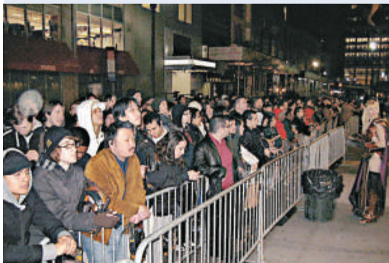
▲位於紐約的首天發售會十三日凌晨舉行，萬人空巷