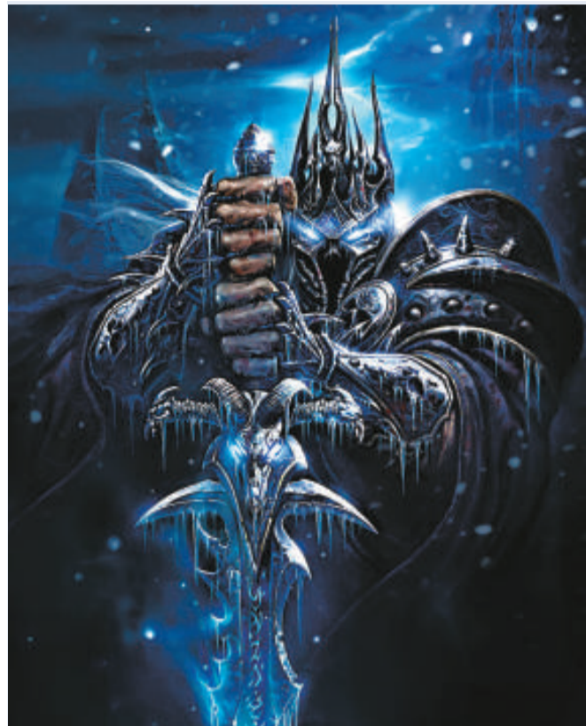
▲《魔獸世界》中的大壞蛋：巫妖王亞瑟

【本報訊】據法新社及英國《每日電訊報》網絡版十三日消息：由美國著名電腦遊戲製造商暴雪公司開發的《魔獸世界》續篇《巫妖王之怒》，十三日凌晨於歐美各國開始發售。全球各地的遊戲迷聞風而至，擠滿街頭等待購買。該遊戲迄今已在全球擁有一千一百萬付費會員，打破多項銷售紀錄，是全球最受歡迎的月費式網上遊戲。