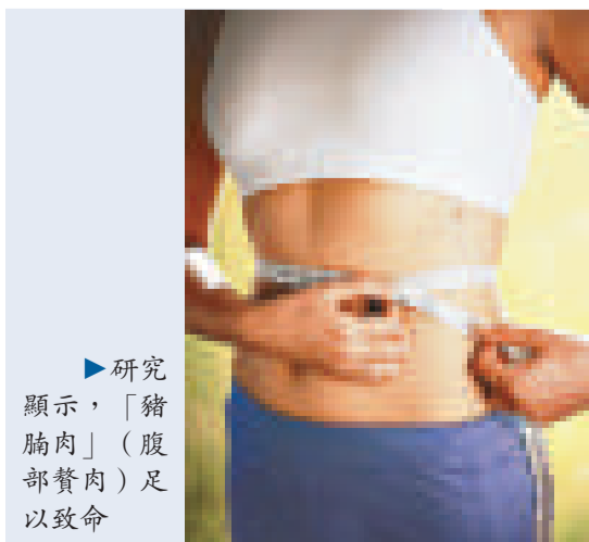
▶研究顯示，「豬腩肉」(腹部贅肉)足以致命

【本報訊】據英國《每日郵報》網絡版十二日報道：許多人以為只要體重正常，便可免於罹患心血管病等與肥胖相關的疾病。但一項新研究發現，反映危害健康的「肥胖」，不是傳統定義中的過重和癡肥，而是腰圍過大。腰部肥胖者早死的風險是腰部瘦削者的兩倍。