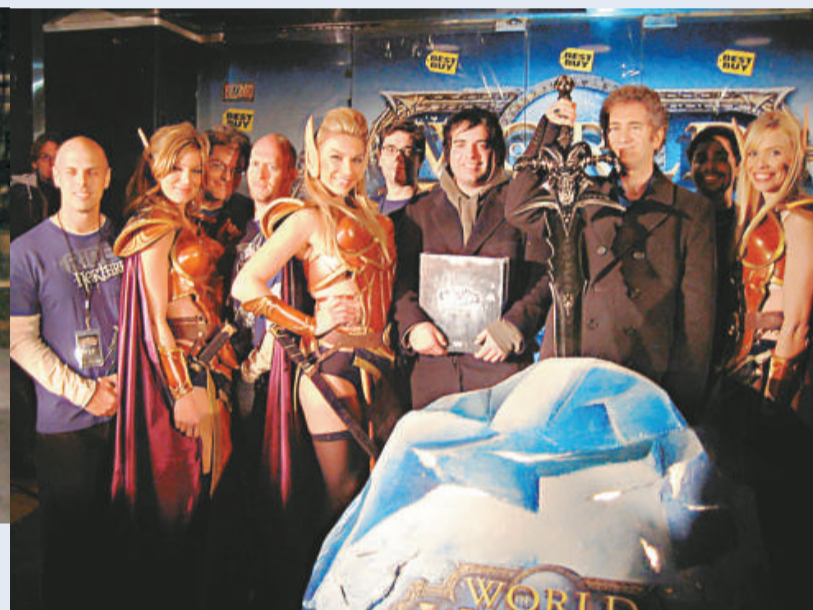
▲機迷扮鬼扮馬，為發售會增添不少熱鬧氣氛