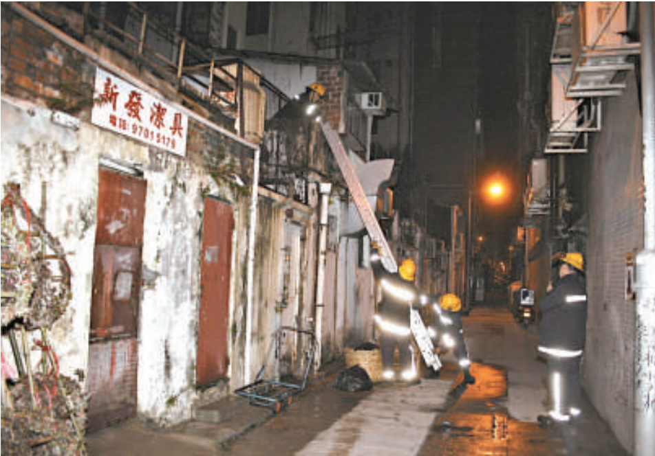
消防員在現場撲救及疏散住客