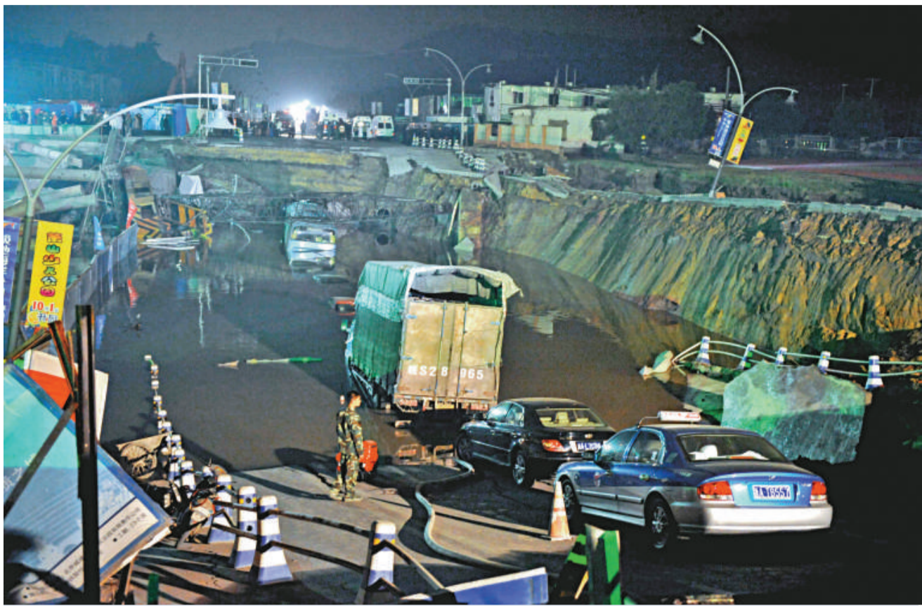
十五日，杭州風情大道地鐵施工工地發生大面積地面塌陷事故，一些行進中的汽車墜入塌陷處

【本報訊】15日下午，浙江省杭州市風情大道地鐵一號線施工現場發生坍塌事故。據救援工作會議透露，坍塌事故塌方口至少壓了50餘人，生死不明。目前已知有16人下落不明，1人死亡，共有19人住院。