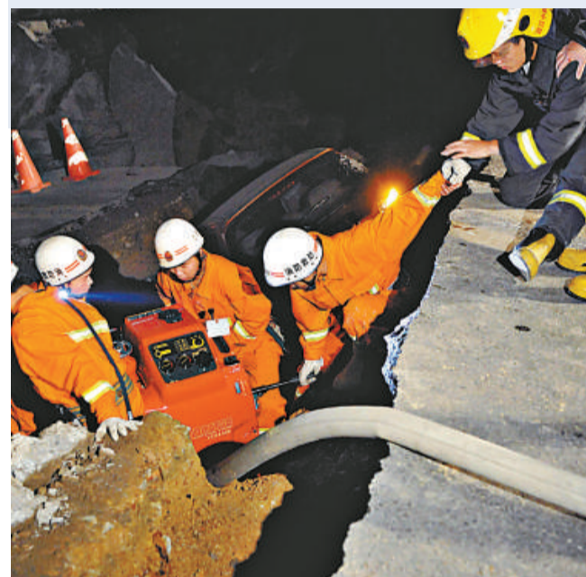
▼杭州消防戰士正在現場積極搶救

綜合中新社、新華社報道，15日下午3時許，杭州八車道的風情大道地鐵施工工地發生大面積地面塌陷、一些行進中的汽車墜入塌陷處。塌陷面積寬約20米，長100米，深20米。墜入塌陷處的車輛可能在10輛以上，塌陷處內還有施工人員，人數暫時不詳。一個包工頭說，他們至少有20人正在地下施工。