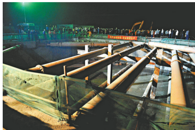
▲杭州蕭山地鐵施工入口

據參與救援工作的武警官員介紹，現場面臨的主要問題之一是如何將倒灌進塌方口的河水排出。杭州消防總隊已經準備了4台抽水機進行抽水，並陸續將沙包堵在決堤口處。