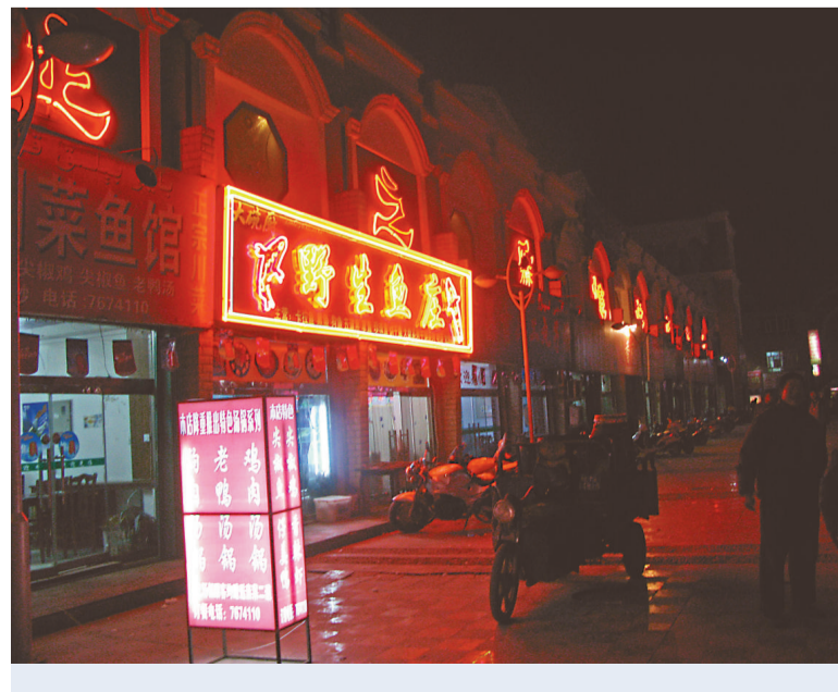
庫車步行街裡店鋪凌晨仍然燈火通明