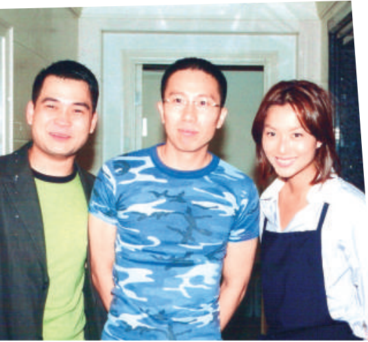
劉雲傑與電影版《百分百感覺》演員鄭秀文與葛民輝合照