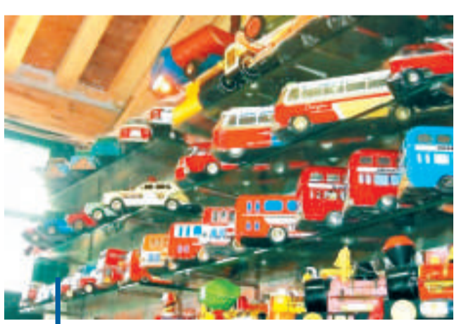
它們曾為兒童們帶來無限歡樂