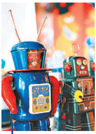
設計簡約的機器人