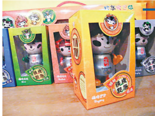
友人饋贈的鐵皮娃娃