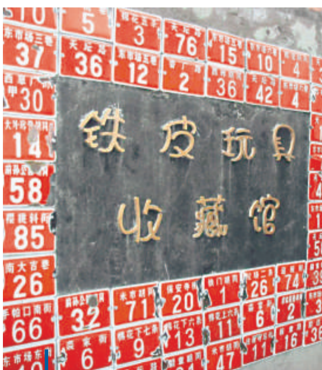
胡同裡的鐵皮收藏館

自從今年「六一」建了這個收藏館, 漸漸打響了名堂, 經常訪客滿門, 也有從外國慕名而來的, 兩口子十分好客, 不論國籍膚色, 不論年齡大小, 來者不拒, 「儘管玩, 儘管拍」。