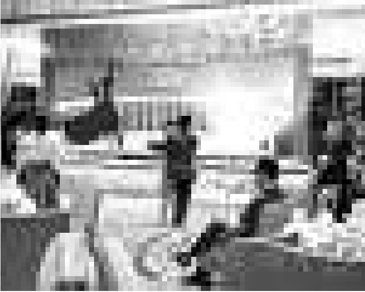
相親會現場

【本報訊】近日，一場名為「遇見」的「紳士淑女私人約會晚宴」在廣州天河匯景新城亞太國際俱樂部悄悄舉行。其中「尋妻紳士」的身家要求為至少擁有 1000 萬資產，而「尋夫淑女」中則不乏選美冠軍和美貌白領。要參與這場高端「相親會」，門票索價 9999 元！