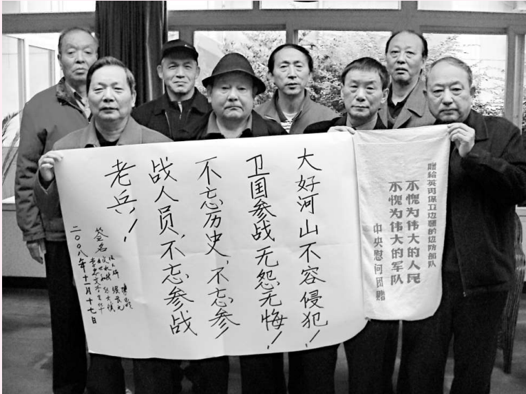
▲本月 8 日，印度外長慕克吉在屬於中國西藏山南地區的錯那縣管轄的達旺地區（印度稱為「阿魯納恰爾邦」）訪問時，再次宣稱「阿邦」是印度領土，引起當年參戰老兵們的強烈抗議