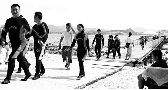
三亞年均 30 萬人次的潛水總量令珊瑚礁生態難以承受（本報攝）

【本報記者楊斌長沙十七日電】由湖南大學設計建造的未陽竹橋被美國《Popular Science》雜誌評為 2008 全球 100 項最佳創新科技成果。