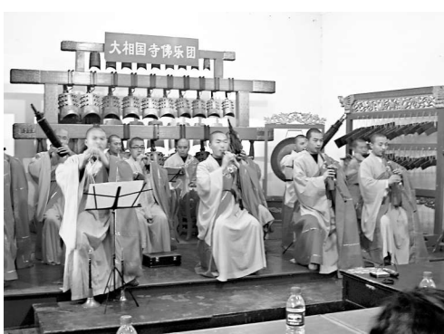
大相國寺可望重現「世界第一佛樂」

大相國寺作為千年古寺，在佛樂表演上歷史悠久，北宋時期是中國最大的皇家寺院和全國佛教活動中心，每逢大型慶典均邀請八方著名樂僧協同演奏佛樂，規模宏大，氣勢恢弘，堪稱天下無雙。惜後漸消沉。近年來，大相國寺培養起專職樂僧，使久已失傳的佛樂表演得以重現，並精心編排了《白馬馱經》、《相國霜鐘》、《寶鼎贊》等 40 餘個樂曲節目。為使大相國寺皇家佛樂演出成為弘揚佛學的載體，成為世界佛學一項