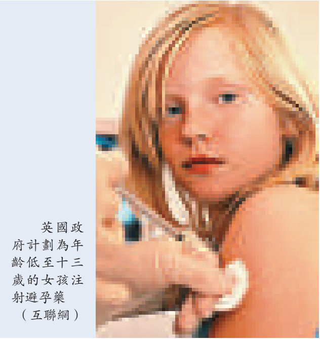
英國政府計劃為年齡低至十三歲的女孩注射避孕藥（互聯網）

【本報訊】據英國《每日郵報》十七日報道：為了遏止不斷攀升的少女懷孕率，英國政府計劃為年齡低至十三歲的女孩注射避孕藥。新計劃將會在全國各地的少女懷孕「熱點」推行。