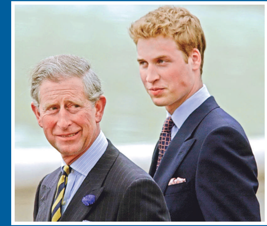
查爾斯王子的支持率已經反超其子威廉王子（右）