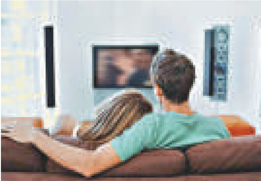
研究指不快樂的人要比快樂的人更喜歡看電視（互聯網）