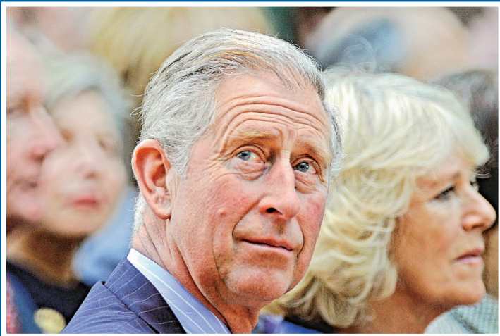
查爾斯有望在六十五歲時成為國王