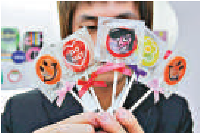
經濟長期低迷，韓國的安全套銷量反而大增。圖為個性安全套

英國皮膚科醫生協會的尼娜·戈德表示，這一研究還處於實驗階段，其成果或許能為新型抗白髮療法鋪平道路。