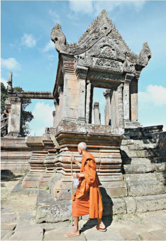
柏威夏寺位於泰國和柬埔寨接壤邊境地區，今年7月獲列入世界文化遺產名錄