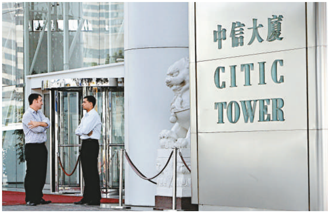
市場認為，中信集團出手拯救後，中信泰富的資金壓力大減

三井住友銀行及其附屬公司在全球31個國家營運，截至今年3月，三井住友銀行在日本國內設有416間分行，而三井住友銀行是日本6大銀行集團中唯一未出現收益下跌的金融機構。日本三井住友金融集團(Sumitomo Mitsui Financial)旗下三井住友銀行發言人表示，該行目前正就潛在合作事宜與東亞銀行展開談判，惟尚未作出正式決定，亦未有透露內容細節。