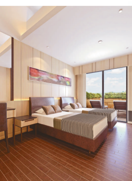
挪亞度假酒店有多種房間選擇，包括雙人房及四至八人團體房

個獨特主題展館糅合了生命教育、多元智能發展和通識教育元素，透過互動遊戲，引發兒童的思維和創意，在愉快的環境中學習。活動包括：在地球村學習品格培育、從話劇中建立自信、音樂創作的啟發、在地球觀察站領悟有趣的科學知識，還有創意無限的小手製作等。