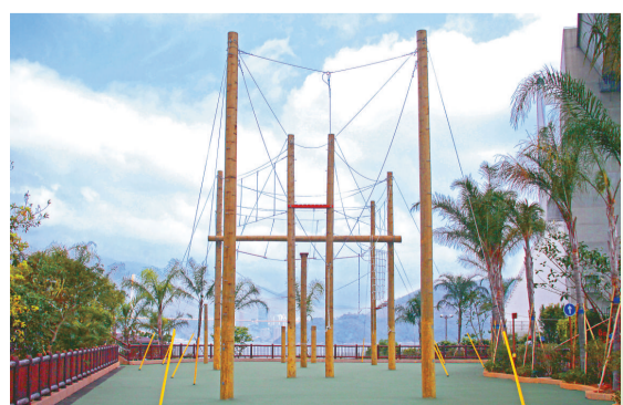
跨越奇園提供全港獨有樓高三層的巨人鞦韆