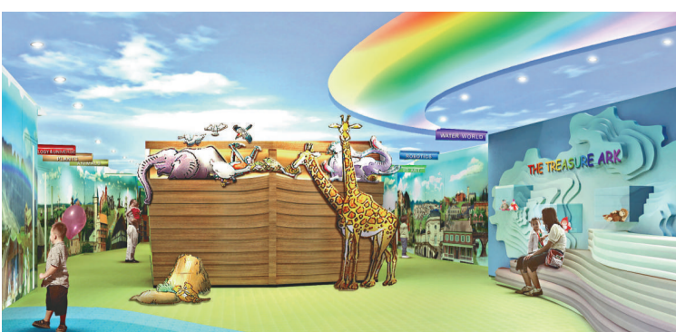
珍愛地球館的 15 個獨特主題展館，糅合了生命教育、多元智能發展和通識教育元素