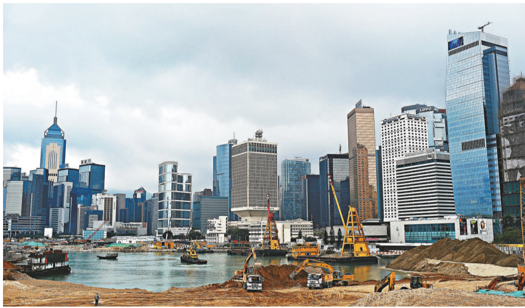
中環填海第三期工程造價激增 (資料圖片)

【本報訊】政府為建造中環灣仔繞道主幹道而在銅鑼灣避風塘進行的臨時填海工程，雖然早前被保護海港協會勝出司法覆核，高等法院裁定《保護海港條例》也適用於臨時填海工程，但政府委託顧問研究後認為，該項臨時填海工程仍然有「凌駕性公眾需要」，符合條例規定，所以應該進行。不過受接連司法挑戰影響，主幹道工程已經延誤，當局建議在中環填海工程進行保護工程，填海計劃開支增加二十二億元，但中環新海濱可提早兩年免受工程滋擾，並配合添馬艦新政府總部預算於二〇一一年完工的步伐。