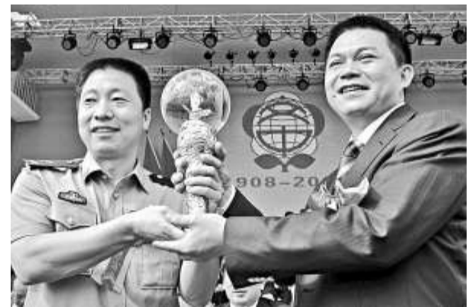
楊利偉（左）向文昌市市長嚴正回贈禮品

據了解，文昌中學是海南首創的縣立中學，前身為玉陽書院，繼而至公書院，而後蔚文書院。曾經跨越明、清兩朝，經歷三個不同政治體制時代，計年三百餘載，為百年來中國基礎教育發展的一個縮影。書院期間，先後造就十六名進士，一百零七位舉人，三十位武舉人，以及培育生員萬餘人。新中國成立至今，文昌中學已成功地為北大、清華輸送八十名優秀人才，並先後六十九次獲得國際級各種獎勵。基於文昌中學為中國教育做出的巨大貢獻，一九八八年，國家教委頒給文昌中學四個無價大字：中國名校！