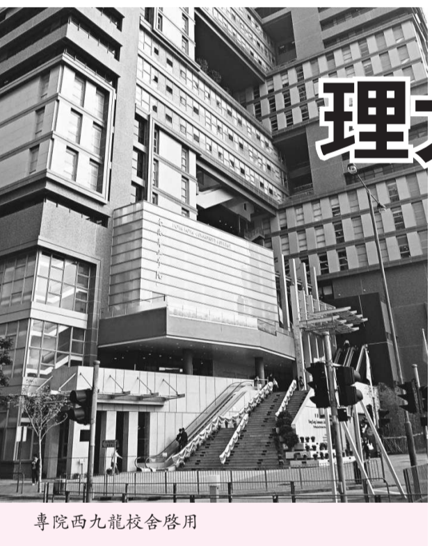
專院西九龍校舍啓用