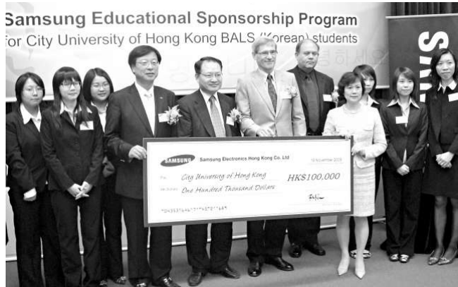
參加頒獎禮的嘉賓與獲獎學生合影

【本報訊】中文大學為擴建圖書館，將暫時拆卸被稱為「烽火台」的大學廣場和「門」雕塑，他日原地重置。中大師生和校友近日隨即在網上展開熱烈討論，一個專門討論「烽火台」事件的群組，啓用不足兩天，便吸引逾二千一百人註冊成為會員，共留下逾一百則留言。有校友留言認為「烽火台」是中大的象徵，校方應妥善保留。更有校友發起在「中大校友日」舉行活動，向校方表達保育「烽火台」的意願。 為應付二〇一二年大學四年制推行後，新生倍增的需求。中大建議在圖書館對開地點向下發展，興建地下圖書館，但地面大學廣場（俗稱「烽火台」）及朱銘雕塑品「門」將被拆卸。中大校長劉遵義日前會見學生，承諾會盡量保留「烽火台」的一磚一瓦，施工期不會超過一年，竣工後會原地重置「烽火台」，又表示因工程趕急，沒有時間再作公開諮詢。 在校長會見學生後，前日有中大人在網上開設群組，供中大師生和校友討論「烽火台事件」，並上載「烽火台」相片和錄像。群組啓用兩天，已有超過二千一百人註冊成為會員，並留下逾一百則留言。 有校友在群組留言，表示劉校長不應只將學生們對烽火台的感情，局限在拍攝畢業照那麼簡單，烽火台是中大的重要建築象徵，更加是中大建校以來的歷史見證，是幾代中大人的集體回憶。學術自由的基礎，前人留下的訓示。想起烽火台，便想起中文大學。又說單是當年大學學制「四改三」，學生塞滿烽火台和百萬大道，就已經是永久保留「烽火台」的理由。 也有校友認同校園發展是有需要的，但中大生都不想中大成為一個沒有回憶的地方，請校方提出任何校園發展的方案時，多考慮學生和校友的感受。亦有校友不明白為何不能在校園另一位置建圖書館，「中大的圖書館從來都唔係centralize (中央化)」，更有校友發起在下月舉行的「中大校友日」，發起活動，向校方表達保育「烽火台」的意願。