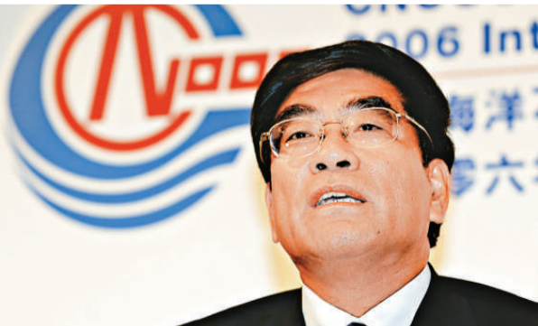
中國海洋石油董事長傅成玉

OPEC主席卡利爾表示，相信OPEC不會在11月29日的會議上，再次調低產量目標。主要因組織需要更多時間，搜集各成員國數據。因此，他個人認為，OPEC下月17日在阿爾及利亞召開的會議，才是有機會決定是否進一步減產。卡利爾又稱，OPEC成員國都意識到確保市場穩定的重要性，同時，OPEC也對世界經濟形勢十分擔憂。