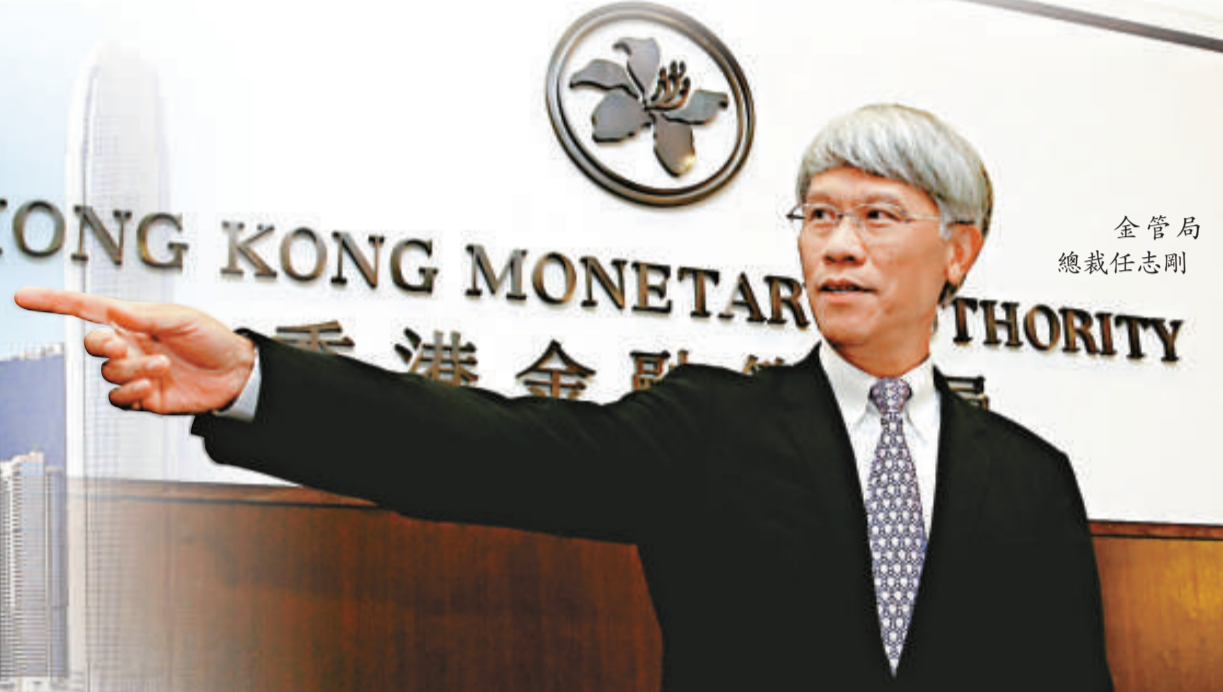
金管局 總裁任志剛