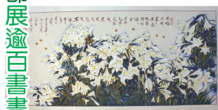
▲李慧勤工筆畫《百合》