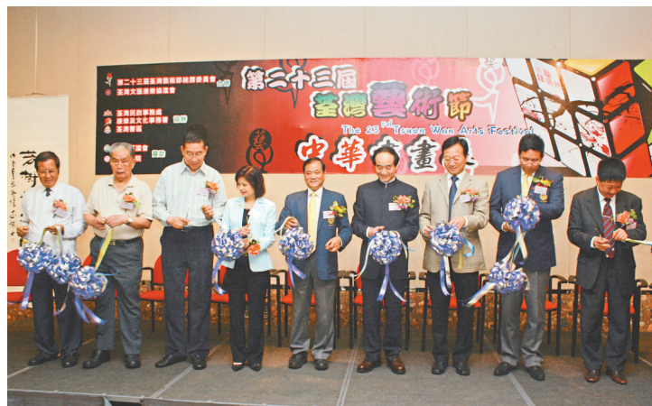
▲嘉賓為荃灣藝術節書畫展剪綵