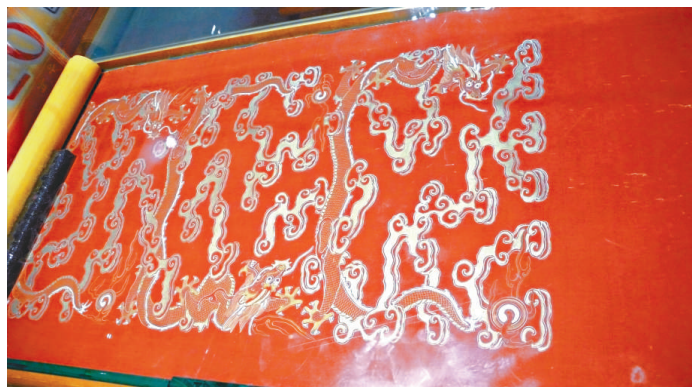
▲故宮舊藏清代絹本描金飛龍大五言聯

是次「故紙香凝——中國箋紙欣賞」即日起至十一月廿四日在中環域多利皇后街九號三樓集古齋舉行。