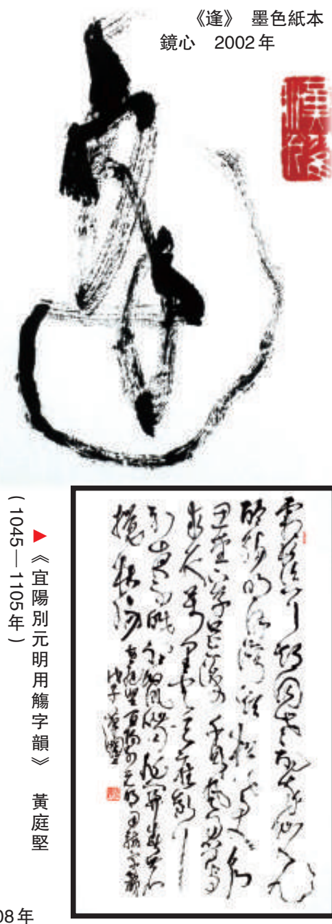
▲《宜陽別元明用簡字韻》 黃庭堅 (1045—1105年)

「方圓一脈：盧漢耀書法」展覽正在香港大學美術博物館舉行，展出港大校友盧漢耀四十一幀草書作品。