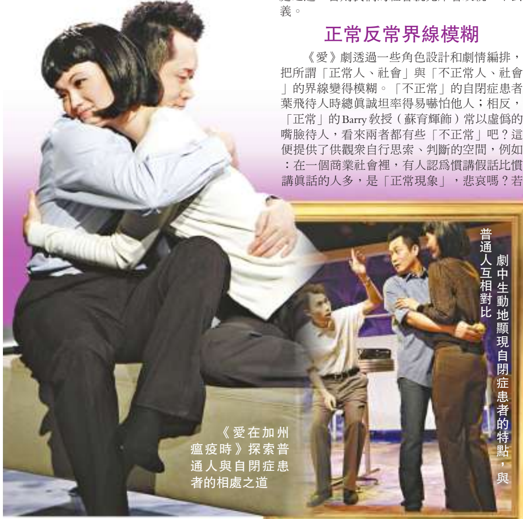
《愛在加州瘟疫時》探索普通人與自閉症患者的相處之道