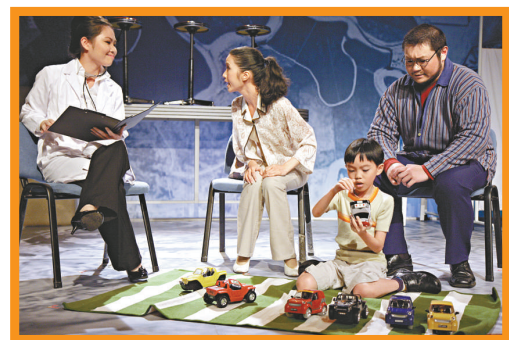
▲「一條褲製作」演員投入演繹《愛在加州瘟疫時》

幾位演病患者的演員均能演活角色的神髓，讓觀眾了解一個自閉症或抑鬱症患者的病徵，而劇中其他配角亦演得很生活感，恍如經歷着一段真實的患病歲月。