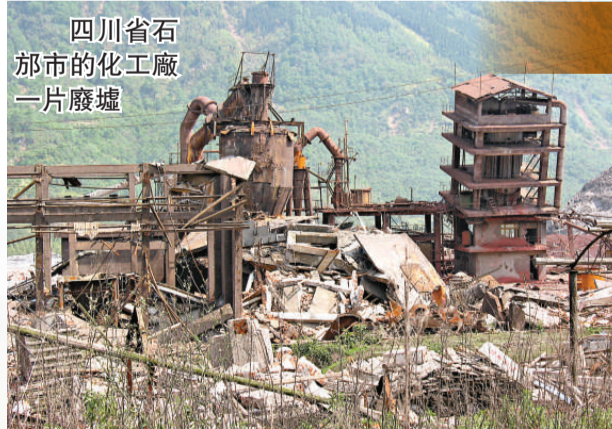
四川省石叻市的化工廠一片廢墟