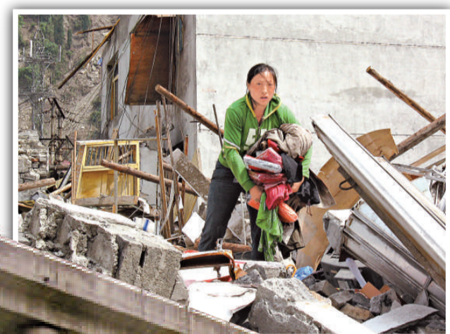
映秀鎮一位災民在震毀的家園上

他介紹，「中心」是魚子溪台地上的中心廣場，中間矗立着60米高的天使主題雕像，底座雕刻着汶川地震中遇難者姓名。廣場周邊由柱廊圍合，站在那裡可以俯瞰整個小鎮。此外，還設立紀念片區、遺址公園片區、愛河兩岸生活服務片區、交通旅遊服務片區和工業片區六大片區，其中居住用地的總面積爲20.76公頃，佔鎮區總建設用地的21.25%，安置人口1.02萬人。