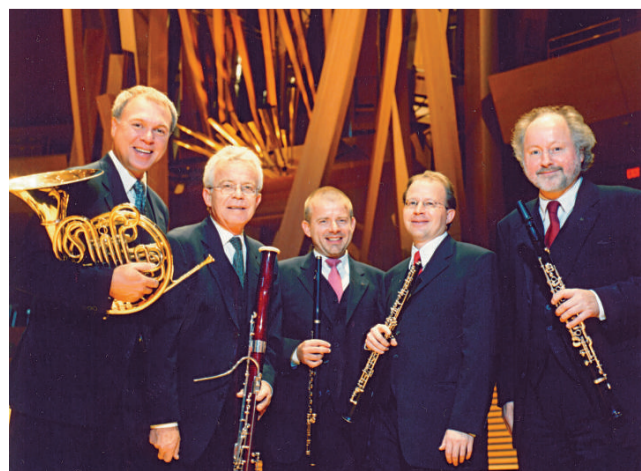
柏林愛樂木管五重奏合作純熟，表現上佳