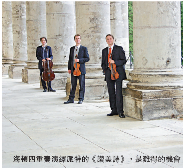
海頓四重奏演繹派特的《讚美詩》，是難得的機會

人，駕輕就熟。不過，筆者專誠觀賞的，不是這首作品，也不是下半場的舒伯特《G大調第十五號四重奏》，而是愛沙尼亞作曲家派特為弦樂四重奏而寫的《讚美詩》。派特是二十世紀音樂奇葩，只集中寫宗教音樂，而且風格典雅古樸。《讚美詩》是他少數室樂的一首，也是唯一寫給弦樂四重奏的一首。曲內共有九個小段，而每小段都是以沉寂作為終結。一般弦樂四重奏音樂會，很少演奏此曲。今次由「海頓」選奏，實在難得，為聽此曲而專誠跑去澳門，亦覺得值。