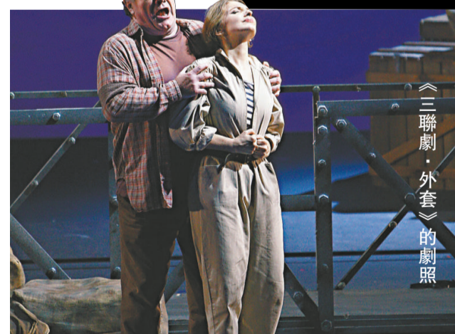
《三聯劇》外套的劇照

其實，可以貫串三齣的，是一個「情」字；《外套》裡船東太太與卸貨工人情愫互生，相約私會，但被船東揭發，卸貨工人因此喪命