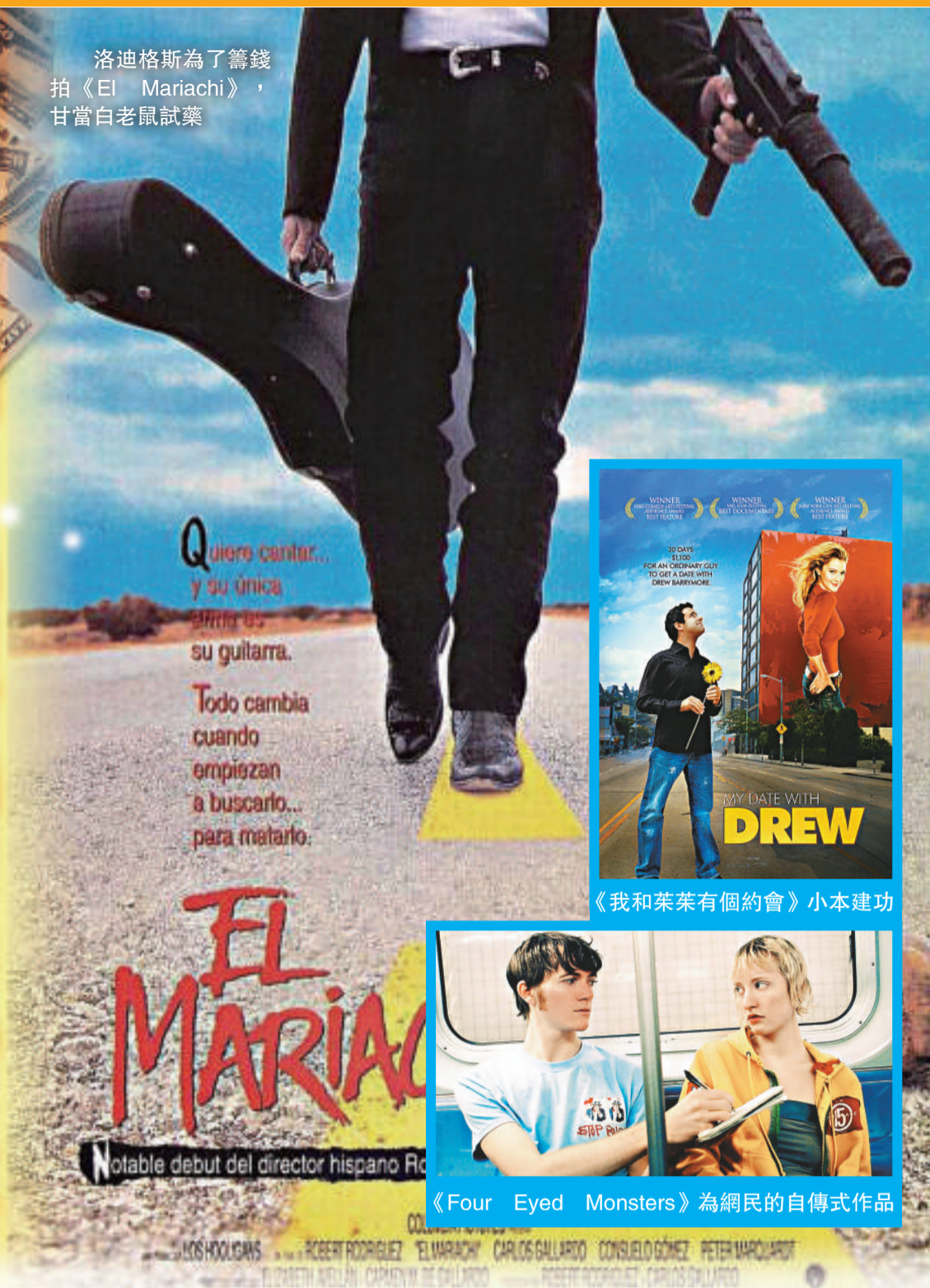
《我和茱茱有個約會》小本建功