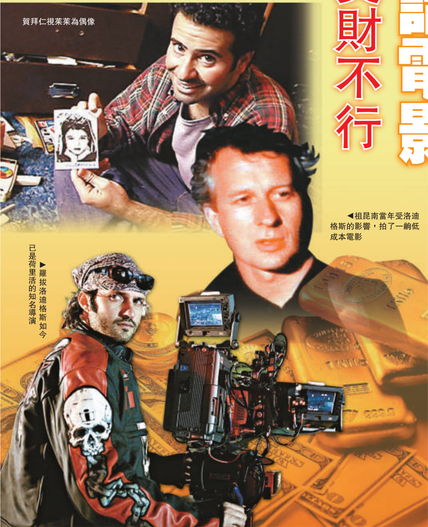
賀拜仁視茱茱為偶像

台灣電影《海角七號》至今本土票房超逾四億新台幣，它的成功現已變成「奇迹」的代名詞。《海角七號》絕對發揮了淡市中兵行險着的果敢，首次執導長片的導演魏聖德，僅拿着五百萬新台幣（約一百一十萬港元）的「國片輔導金」開戲，最後埋單五千萬新台幣，令他要變賣房產，還要債台高築。幸好有心人有好報。