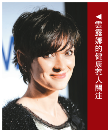
雲露娜的健康惹人關注