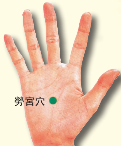
按摩掌心勞宮穴有減壓作用