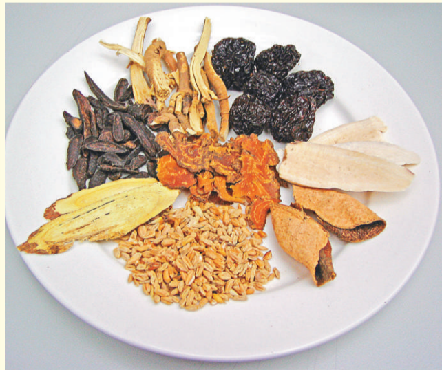
煩躁、胸悶氣痛、呃逆眩暈 柴胡舒肝湯

除以上的方法外，再給大家分享一些食療方，希望幫大家在壓力指數高企的日子提供一些支持——