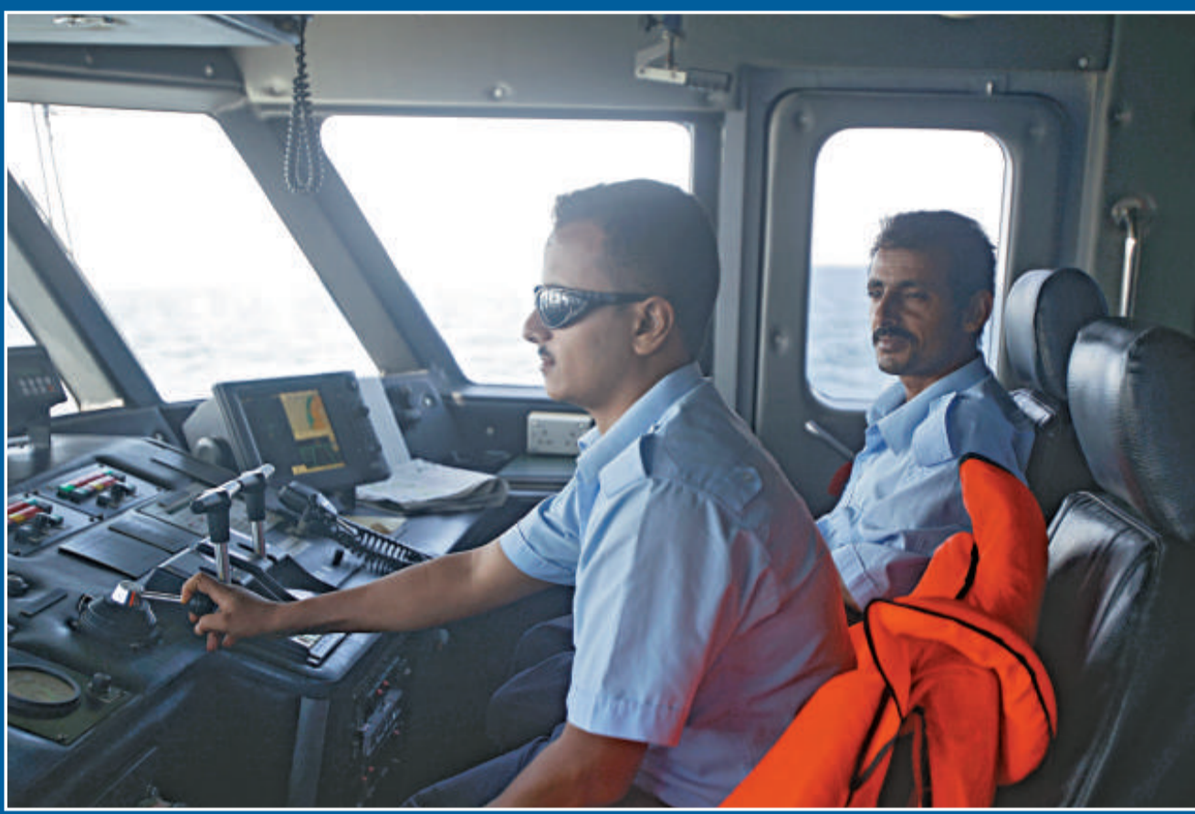
▲也門的海軍在執行巡邏任務

另外，騎劫伊朗伊爾斯蘭共和國航運公司管理香港註冊貨輪「The Delight」號的索馬里海盜提出了放船及放人的條件。伊朗伊爾斯蘭共和國航運公司一名高層對路透社說，公司方面正聯繫該船。公司方面二十日曾與該船取得聯繫，船上各人員健康良好。公司正與海盜討論放船及放人事宜。