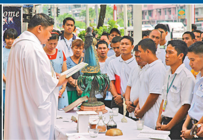
▲馬尼拉的船員在為被海盜綁架的同行祈禱