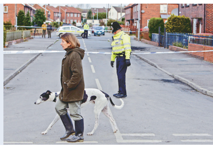
▲爆炸現場被警察封鎖