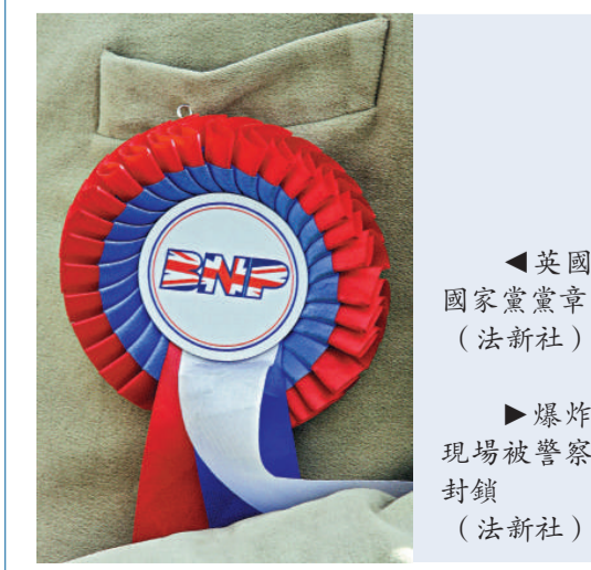
▲英國國家黨黨章

美聯社當天發表聲明說：「在目前這種複雜而艱難的時刻，美聯社也像全球其他公司一樣，正在制定相應的經營戰略。」聲明指出，這次的裁員計劃會考慮到該通訊社的各個地區和部門。聲明同時強調美聯社繼續成為全球權威新聞網的宗旨不會改變。