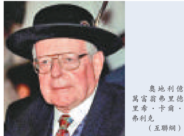
奧地利億萬富翁弗里德里希·卡爾·弗利克 (互聯網)

【本報訊】綜合報道：兩年前去世的奧地利億萬富翁弗里德里希·卡爾·弗利克上週遭人神秘盜屍，其遺體連同幾百公斤重的花崗岩棺材同時不翼而飛。奧地利警方正在調查這宗離奇的盜屍案。