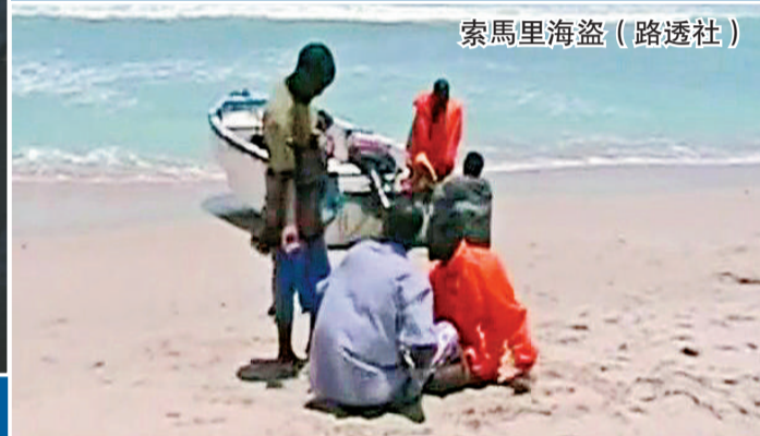
索馬里海盜