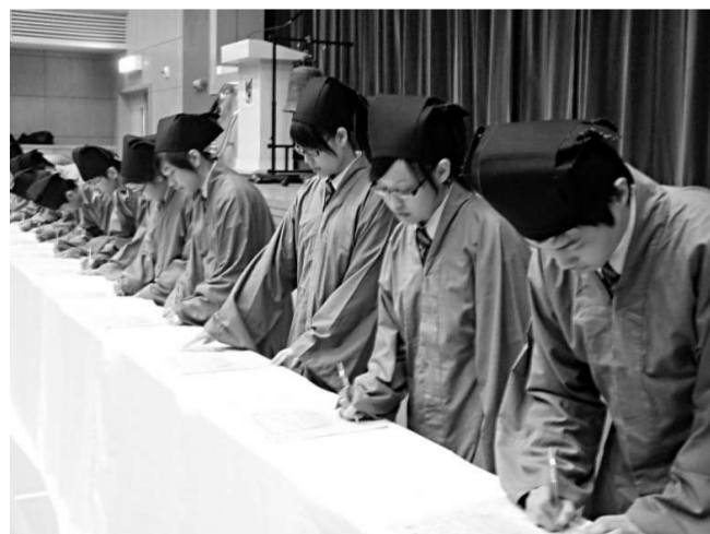
加冕學生宣讀約章

另外，關於教育學院申請正名大學問題，孫明揚說，教資會正撰寫報告，預計一個月後完成，教育局要對報告進行審議，之後才能作出決定。他還表示，每年政府會有四分之一開支用在教育方面，雖有「海嘯」影響，但明年的開支不會減少。