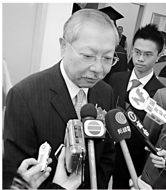
孫明揚表示，有信心明年初完成教學語言微調方案

【本報訊】嶺南大學社區學院昨日舉行第六屆畢業暨獎學金頒授儀式，由嶺大校長陳玉樹主禮。本屆嶺大社區學院共有二百八十多名副學士畢業生及一百三十名副學士先修畢業生，而近六成選擇繼續升學的畢業生則升讀嶺大二年級學士學位課程。 本屆副學士畢業生包括六十四名人文學科副學士、一百八十七名商學副學士和三十二名社會科學副學士。此外，個別成績優異的副學士一年級同學，更成功升讀嶺大一年級學士學位課程，可見同學的整體學習表現已經受到認同。