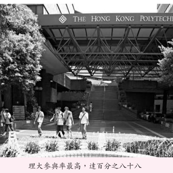
理大參與率最高，達百分之八十八

IELTS 是一個由劍橋大學考試局、英國文化協會、IDP 澳洲教育共同認可的測試，考核英語聆聽、閱讀、寫作及會話能力，以〇至九分評核考生成績。去年八大院校應屆畢業生參加 IELTS 的總平均分為六點六七（滿分是九），介乎良好與優良之間，而香港大學是唯一突破七分（優良）的院校。