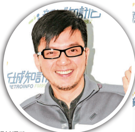
明哥否認唱鹹濕歌

問祖兒會否為轉去細場演出而失望？她道：「冇，依家反而多咗時間準備，而且自己亦有預計一步登天去大場演出，依家反而有下一個目標，所以要儲多啲國語歌。（可會為報到騷怒？）邊聽得咁多，最緊要出來做得好。」另外，對於紅館將於明年二月重開，問明哥可會申請開演唱會？他坦言公司的演唱會部門有問過他，但自己就希望儲多些歌再開。