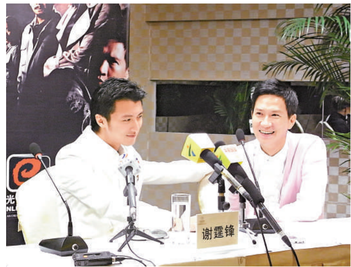
霆鋒和家輝內地宣傳很疲累，但仍強顏歡笑