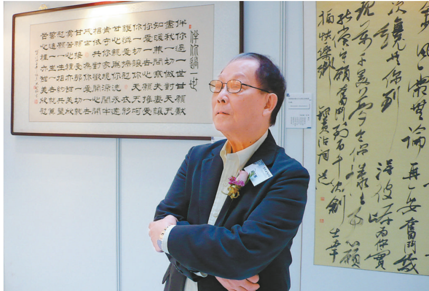
▲顧嘉輝在參觀「黃霑經典歌詞書法展」時，緬懷故友，頗有感觸