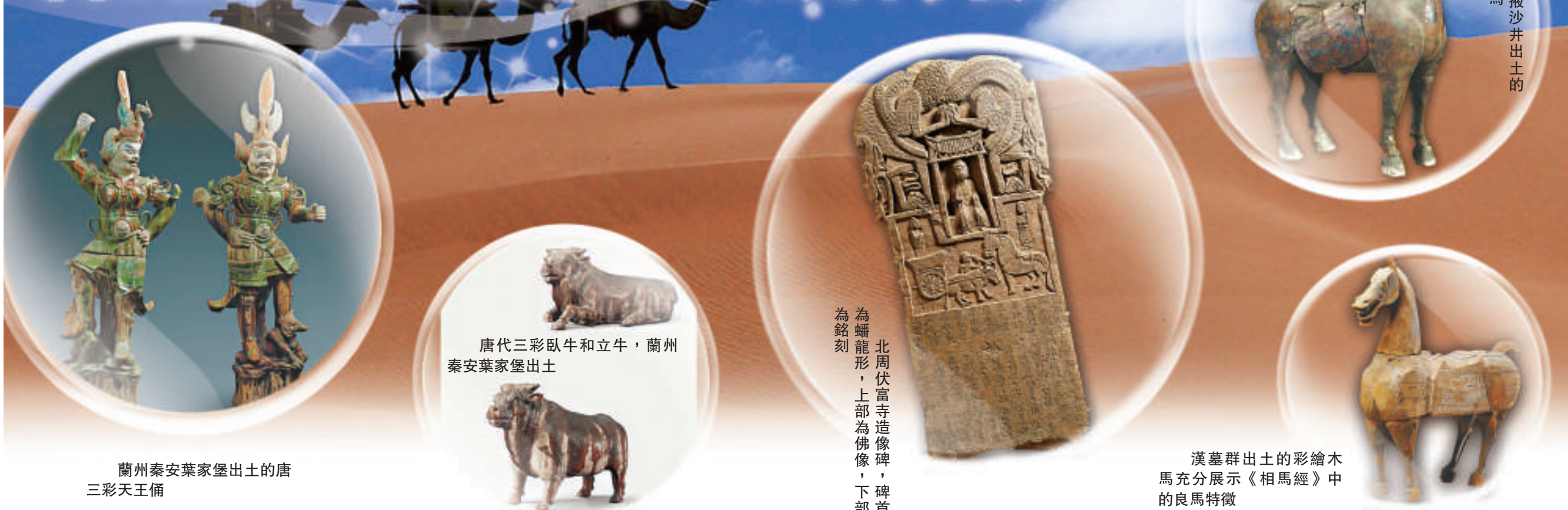
漢代銅馬 張掖沙井出土的