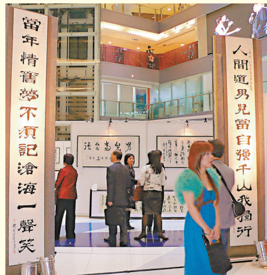
▲展場入口掛着一對以黃霑歌詞寫成的大對聯