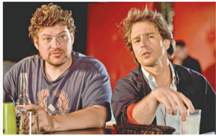
▲森洛基威(右)在新片中飾演備受性幻想折磨的男子