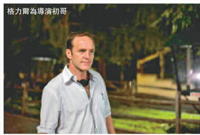
格力爾為導演初哥