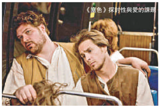
《窒色》探討性與愛的課題