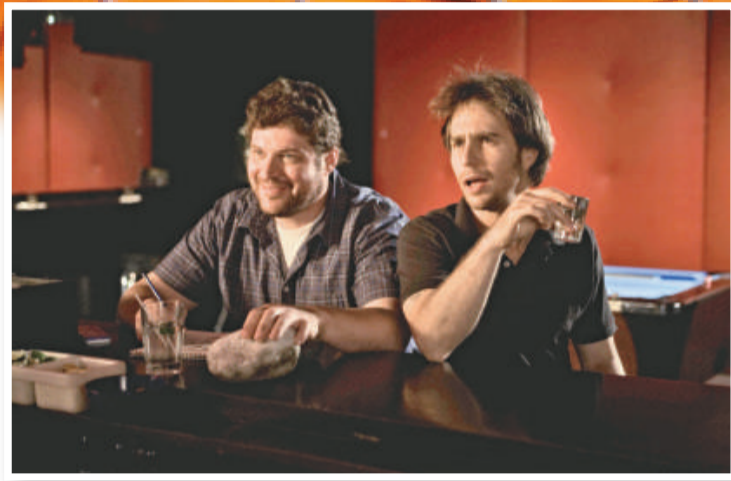
《窒色》的故事匪夷所思