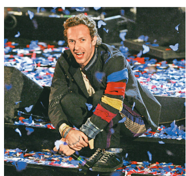
▲Chris Martin 計劃作獨立發展