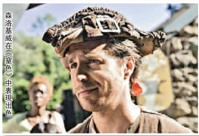
森洛基威在《窒色》中表現出色