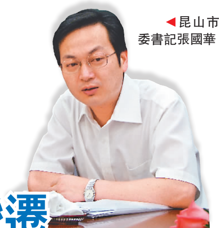
▲昆山市委書記張國華

他說，未來5到10年，昆山的主要發展目標將在中國率先達到中等發達國家和地區的水平。在此過程當中，昆山市將始終堅持「把『富民』作為第一導向，強調小康達不達標群眾說了算，衡量富不富不以平均數代替大多數，不斷提高群眾對全面小康的公認度」。