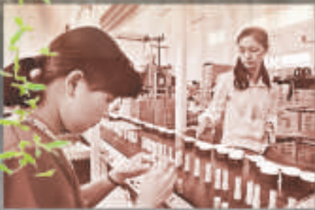
▲昆山經濟技術開發區化妝品容器廠

1983年春節前夕，年近八旬的鄧小平南下蘇州和杭州，就中共十二大確立的「從1981年起，到20世紀末在20年時間裡實現全國農業年總產值翻兩番、達到『小康』水平」的戰略目標進行實地調研。為期12天的蘇杭之行給這位「改革開放的總設計師」留下了非常深刻的印象，建設小康社會的宏偉構想在他腦中逐漸成型。