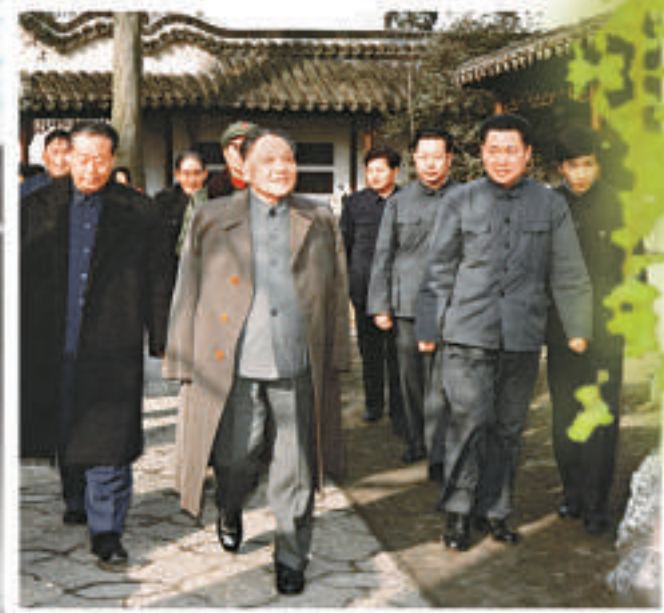
◀1983年鄧小平視察蘇州