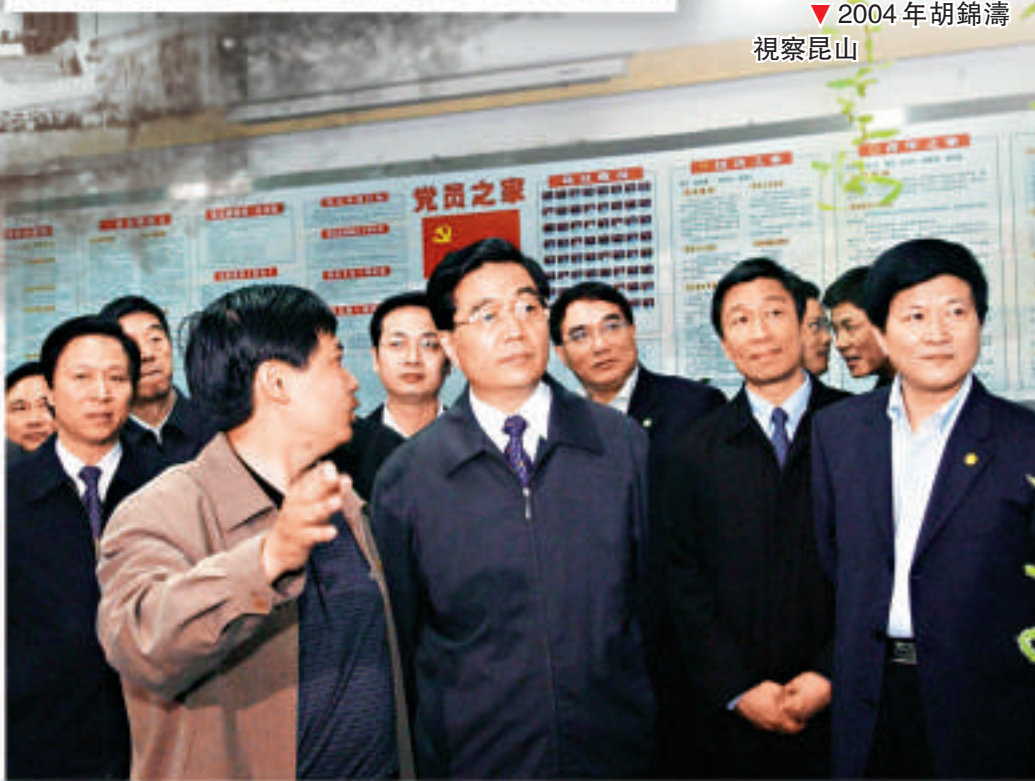
▼2004年胡錦濤視察昆山