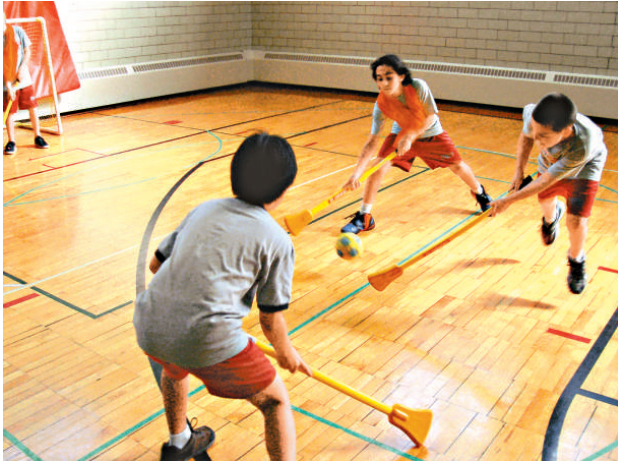
調查顯示瑞士學生一般不愛在課餘參與運動

調查顯示，若家長愛好運動，孩子也會喜歡體育活動；家長的體育運動水平愈高，孩子參與運動的時間愈長。沒有專業引導的孩子通常特別不愛運動。至於該國青少年和兒童最喜愛的運動項目，則包括足球、單車和游泳。