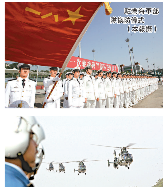
駐港海軍部隊換防儀式

772導彈護衛艇編隊，緩緩駛入駐軍海軍基地昂船洲碼頭，接替輪換出港的770導彈護衛艇編隊。 這次駐港部隊輪換行動，是根據《中華人民共和國香港特別行政區駐軍法》關於「香港駐軍實行人員輪換制度」的規定和中央軍委的命令而進行，部隊輪換後，駐軍在香港的部隊員額及裝備數量，與輪換前一樣。 張仕波少將說，此次輪換出港的駐港部隊，在駐守香港期間，堅決貫徹「一國兩制」的方針，依法履行防務職責，圓滿地完成各項任務；他充分肯定部隊在港履行防務期間的出色表現，對於今次部隊輪換出港表示歡迎。 張仕波少將表示，感謝香港特區政府、社會各界及廣大市民對於駐港部隊工作及生活上的關心與支持。他透露，今次輪換進港的部隊，已在內地基地進行認真的訓練和學習，提高部隊的綜合素質。部隊除了熟練地掌握軍事技能外，亦掌握香港基本情況，為在香港有效履行防務職責，打下堅實基礎。