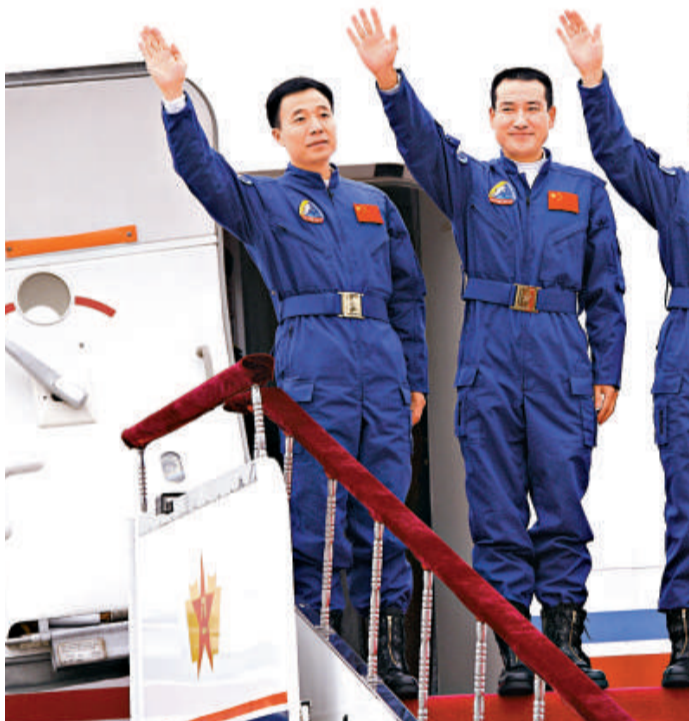
三名神七航天員翟志剛(中)、劉伯明(右)及景海鵬(左)將於下周五訪港

【本報訊】「神七」航天英雄訪港日程已定。據悉，三名「神七」航天員翟志剛、劉伯明、景海鵬已定於下月五日訪港四天。期間將往香港科學園、中文大學參觀，與學生、市民近距離接觸，還將贈送香港一批太空「珍品」。而一場由三萬市民出席的歡迎大匯演將是此次訪港行程的「壓軸戲」。在當前金融海嘯肆虐之際，航天英雄訪港帶來正面信息，必將增強港人逆境自強的信心。