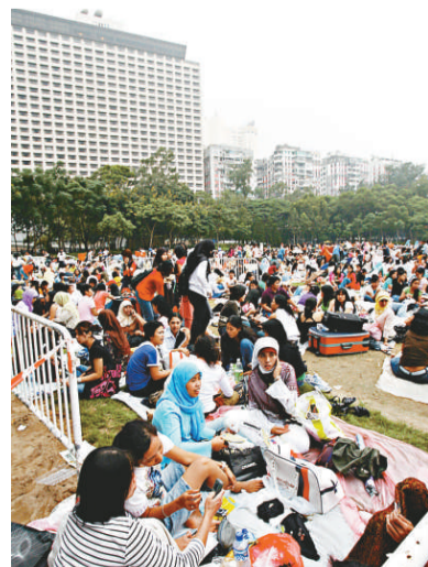
議員要求永久撤銷外傭稅 (資料圖片)

政府日前公布，把爭議多時的「外傭稅」豁免期限由兩年延長至五年，至二〇一三年七月三十一日，僱主在未來五年都無須繳付每月四百元外傭稅，豁免包括新合約及續簽的合約。