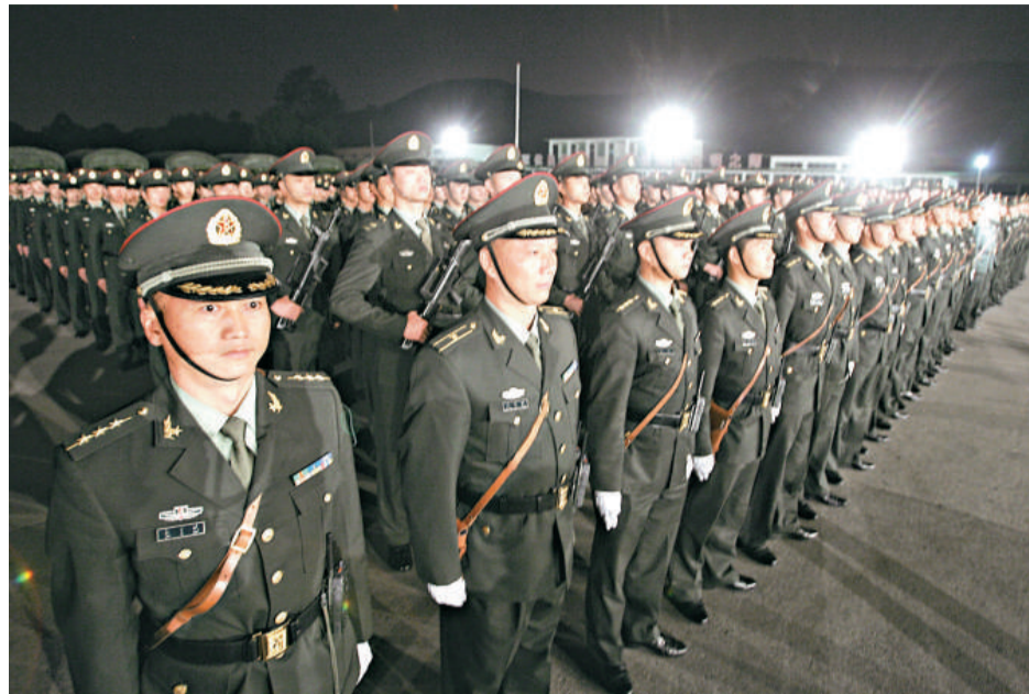
輪換進港和出港的陸軍官兵在新軍營進行交接儀式

【本報訊】記者黃俊鋒報導：解放軍駐港部隊海、陸、空三軍部分建制單位和裝備，昨日凌晨零時至中午，完成駐港解放軍自一九九七年進駐香港後的第十一次輪換，部隊輪換後，駐軍在香港特區的部隊員額及裝備數量，維持不變。主持陸軍部隊輪換交接儀式的駐軍司令張仕波少將表示，駐港部隊將嚴格遵守《基本法》、《駐軍法》及香港特區的其他法律，並忠實履行職責，盡力為維護香港長期的繁榮安定作出貢獻。 昨日凌晨零時，輪換進港的陸軍和空軍地勤部隊，率先駕駛一輛輛的運兵車、裝甲車和通訊車，在香港警隊的帶領下，通過落馬洲口岸駛入解放軍駐港部隊各軍營，並在凌晨一時三十分，由駐軍司令張仕波少將、政治委員劉良凱中將主持陸軍部隊輪換交接儀式。 另外，昨日上午九時五十分，由六架直升機組成的空軍部隊駐港編隊，飛抵石崗空軍營地，接替即將輪換出港的空軍部隊。最後，在昨日上午十一時三十分，海軍部隊