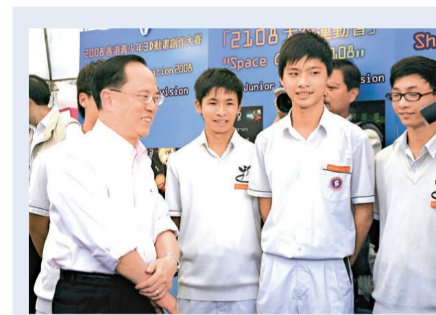
曾蔭權(左)民望回升 (資料圖片)

另外，財政司司長曾俊華昨日出席香港管理協會活動時表示，在制訂新一份預算案時他主要有三項考慮：增加就業職位、增強香港競爭力、有利香港長期發展。他希望預算案的措施能重振香港經濟，同時提高市民的生活質素。雖然如此，他預期新一年度將錄得更高的財政赤字。