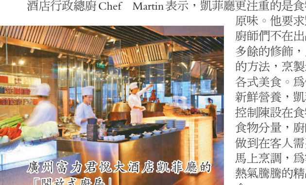
廣州富力君悅大酒店凱菲廳的「開放式廚房」自助餐

凱菲廳美食琳琅滿目，客人在凱菲廳可以品嚐到琳瑯滿目，種類繁多的各式美食：中式的有廣東燒臘，各式小炒，點心等；西式的有意大利美食，美式燒烤，扒類，德國香腸，法式焗牛等；日本料理有壽司，刺身，鐵板燒，天婦羅等；甜點有酒店自製巧克力，各式特製蛋糕，餡餅，雪糕和新鮮烤麵包等；前菜櫃檯主要是歐洲和傳統的中國餐前小菜；果汁吧提供新鮮果汁及各式飲料。