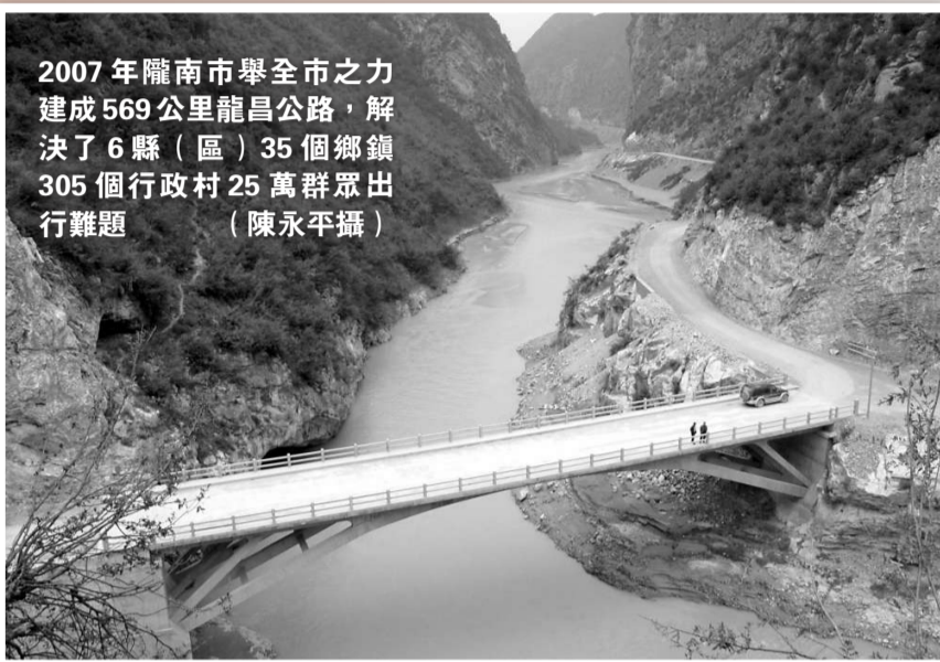
2007年隴南市舉全市之力建成569公里龍昌公路，解決了6縣(區)35個鄉鎮305個行政村25萬群眾出行難題

武都至隴子溝公路是甘肅高速公路建設史上工程難度最高、造價最高、橋樑最多的高速公路。該項目地處隴南山區，大部分路段在深山峽谷中穿行，橋樑隧道約佔全線路長的70%，最長隧道達9公里，每公里造價近9000萬元。武都至隴子溝公路建成後，甘川公路全線將縮短里程146.37公里，甘肅省14個市州政府所在地除甘南藏族自治州外的13個市州將全部實現高速公路連接。