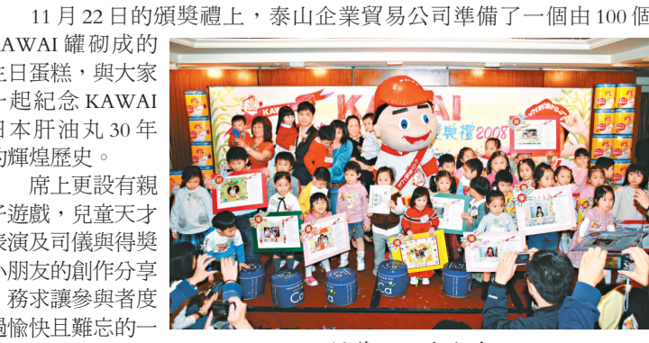
得獎小朋友大合照

這次KAWAI舉辦的兒童相架設計比賽，吸引過千名的幼稚園學生參加，是次比賽總共分為K3、K2及K1共3個組別，每一位小朋友均發揮他們的無限創意及心思，製作出與眾不同的生日相架。每位勝出組別的冠、亞及季軍，分別獲頒得獎證書及價值港幣1,000元、500元及300元的禮品，鼓勵他們向藝術創作方面發展。由於很多作品表現出小朋友內心世界的美麗景象及創意潛能，今次頒獎禮另頒發多個優異獎，以表揚他們的創作及設計能力。