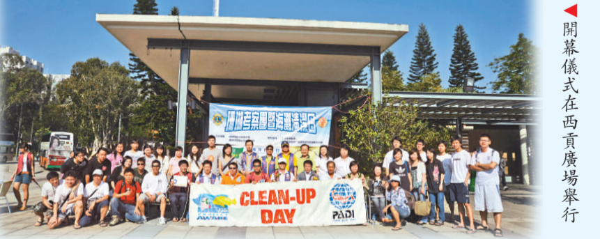
開幕儀式在西貢廣場舉行